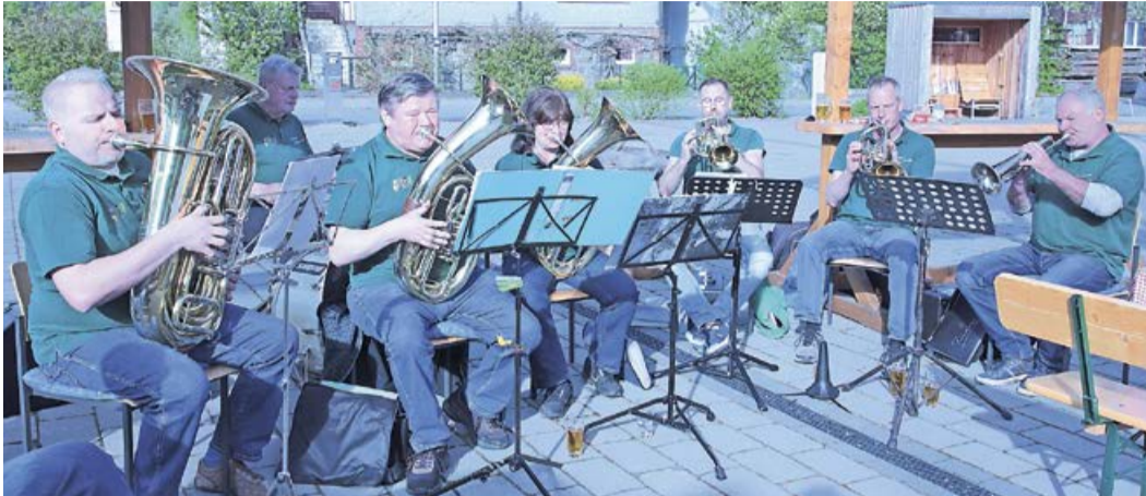
Mit Blasmusik vom Feinsten stimmte eine Abordnung der „Sauerland-Musikanten“ die Besucher perfekt auf den „Musikanten-Treff“ und somit auf den „Tanz in den Mai“ ein.

Hervorragendes Wetter sorgte für gutgelaunte Besucher!