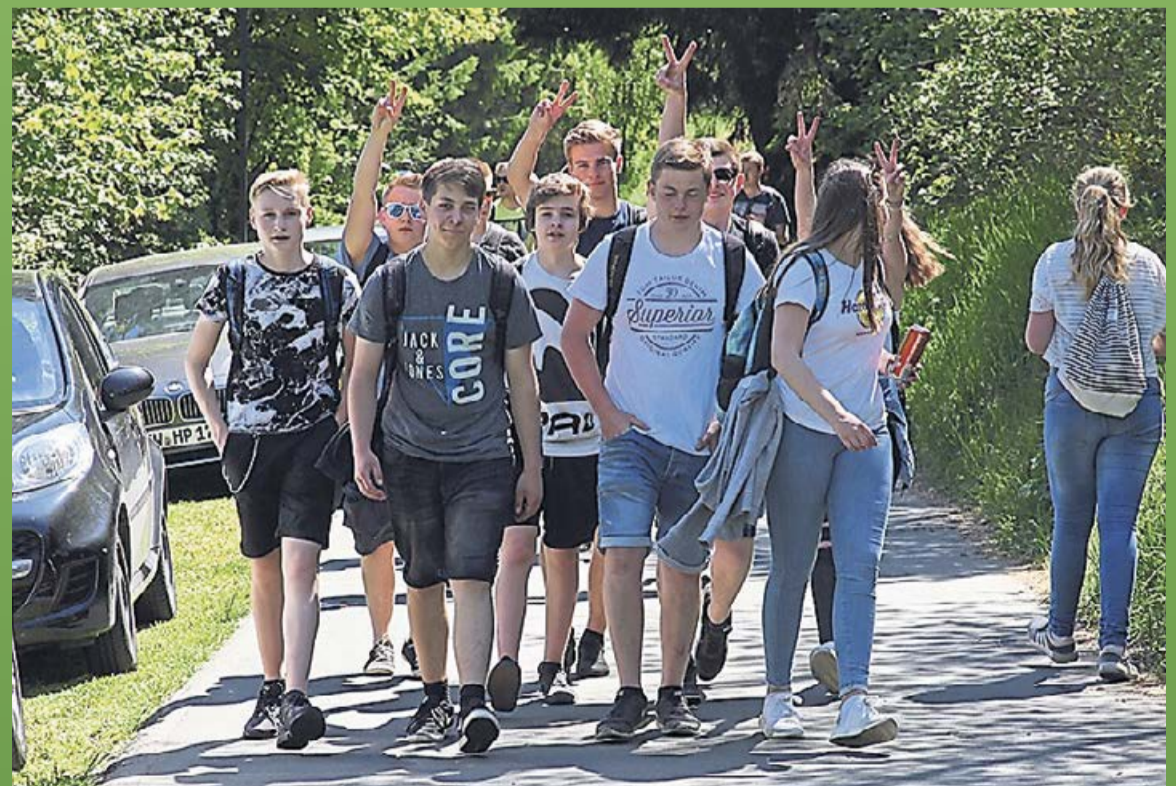
Gleich ist es geschafft und der Vatertags-Party in der Krimmelsdell mit einer kühlen Erfrischung und leckeren Würstchen und Steaks vom Smoker steht nichts mehr im Wege. Auch wenn die hier abgebildeten Herren als „Väter“ doch eher eine „Mogelpackung“ sind.

wieder voll funktionstüchtig. Für Getränke und Speisen ist bestens gesorgt. Die Gäste erwartet wieder der XXL-Riesen-Smoker, der als Dampflok getarnt auf einem eigens dafür umgerüsteten Truck auf den Festplatz rollt. Hier gibt es feinste amerikanische Barbecue Spezialitäten wie Pulled Pork und Spareribs. Natürlich dürfen auch Curry Wurst & Co. nicht fehlen. Die gesamte Veranstaltung wird bei freiem Eintritt erlebt.