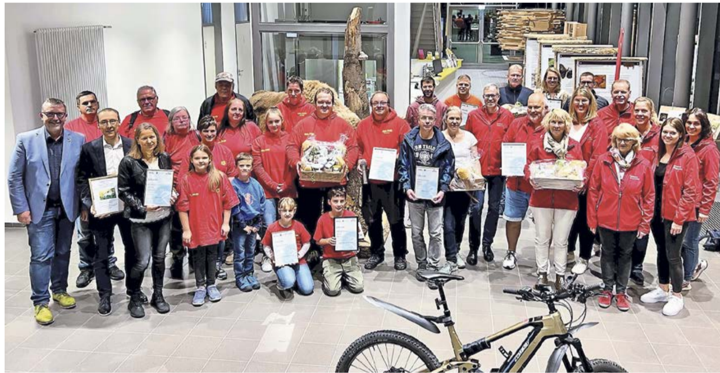
So sehen Sieger aus – die des Vorjahres. Denn im Team macht Radeln am meisten Spaß. Auch in diesem Jahr findet das Stadtradeln in Bad Berleburg wieder statt.