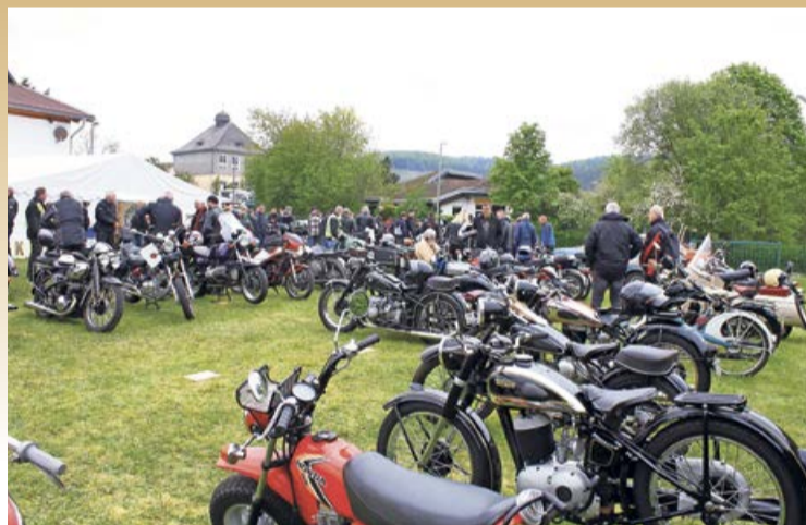
Auch in diesem Jahr gibt es in Oberndorf wieder viele alte Motorräder zu bestaunen.

Oberndorf. Von Freitag, 10. Mai, bis Sonntag, 12. Mai, findet auf dem Schützenplatz in Bad Laasphe-Oberndorf das diesjährige Oldtimertreffen und Maico-Treffen der Freunde alter Krafräder Wittgenstein statt. In Verbindung mit dem Oldtimertreffen wird seit über 20 Jahren ein Maico-Treffen veranstaltet. Seit 1934 war die Firma Maico war ein deutscher Motorradhersteller. Im Jahr 1983 musste Maico die Tore schließen. Aufgrund der Übermacht des japanischen Wettbewerbs erging es vielen deutschen Motorradherstellern so. Auch in diesem Jahr kön-