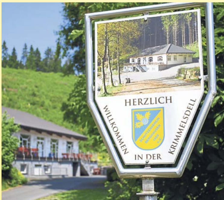
In der Krimmelsdell wird am kommenden Wochenende wieder Jungschützenfest gefeiert.