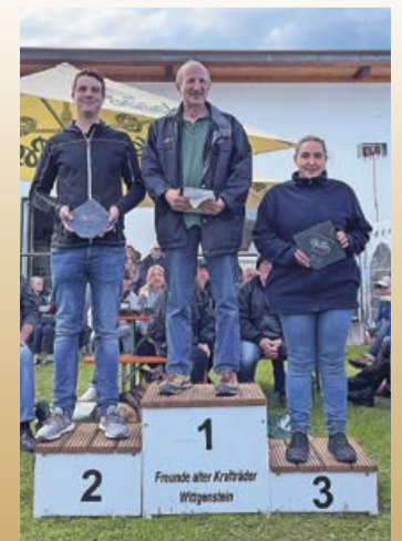
Teilnehmer können hier Ihr Wissen und Können auf die Probe stellen.