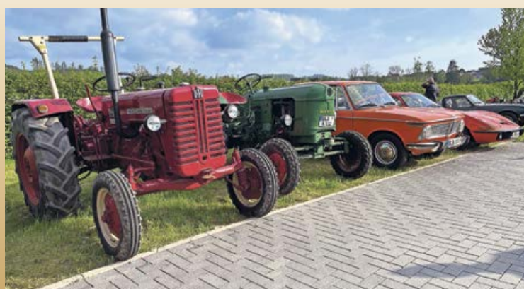
Für alle Oldtimer-Freunde gibt es am Samstag wieder viel zu sehen und zu bestaunen beim 34. Oldtimer- und Maico-Treffen.