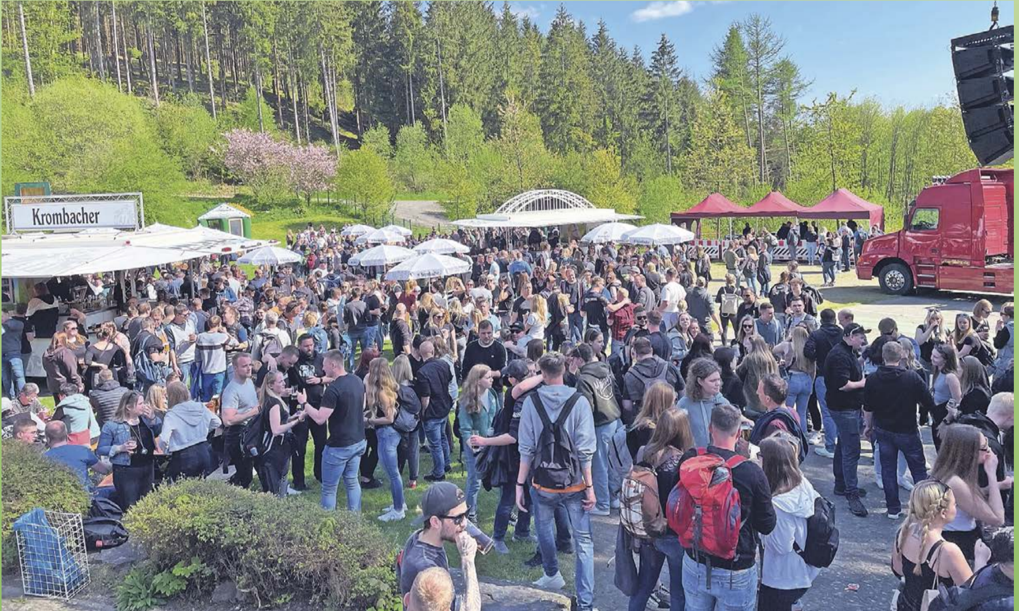
Die Krimmelsdell ist immer wieder ein beliebtes Wanderziel an Christi-Himmelfahrt. Schließlich warten jede Menge leckere Speisen, kühle Getränke, Live-Musik und viele Bekannte auf die zahlreichen Vatertags-Wanderer.