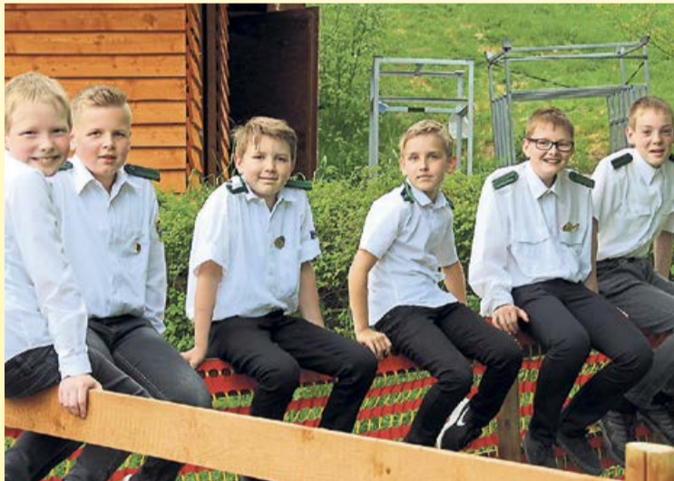
Auch die jüngsten Schützen legen in Berghausen an.