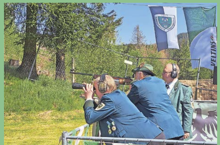
An Himmelfahrt wird wieder angelegt: Der Schießverein Erndtebrück 1911 e.V. geben den buchstäblichen Startschuss in die Saison der Schützenfeste.

auf die Insignien beteiligen. Es warten wieder attraktive Preise auf die Gäste. Der Fuchsrain ist neben Anhängern des traditionellen Schützenwesens auch immer ein beliebter Anlaufpunkt für Wandergruppen. Das großzügige Gelände bietet viel Platz, den Tag zu genießen. Auf Kinder und Junggebliebene wartet eine Hüpfburg. Für das leibliche Wohl ist natürlich für Groß und Klein gesorgt. Die Krönung der neuen Regenten steht am Samstag, 15. Juni, am Fuchsrain an. Dann feiert der Schießverein Erndtebrück 1911 sein Schützenfest.