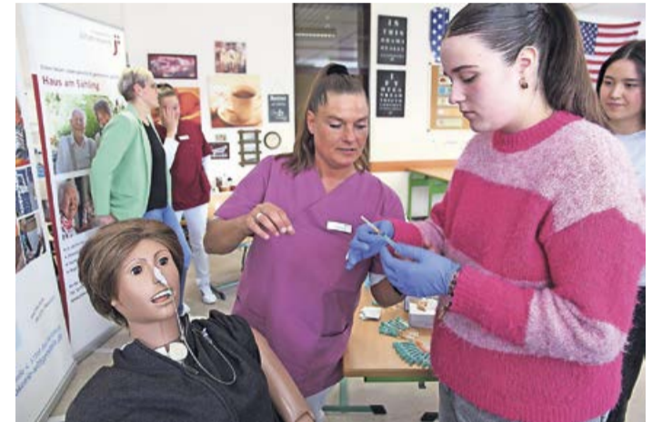
„Den Schutz über der Injektionsnadel immer nach vorne abziehen!“ Natürlich fanden die praktischen Elemente der Ausbildungsmesse immer unter fachlicher Anleitung statt.