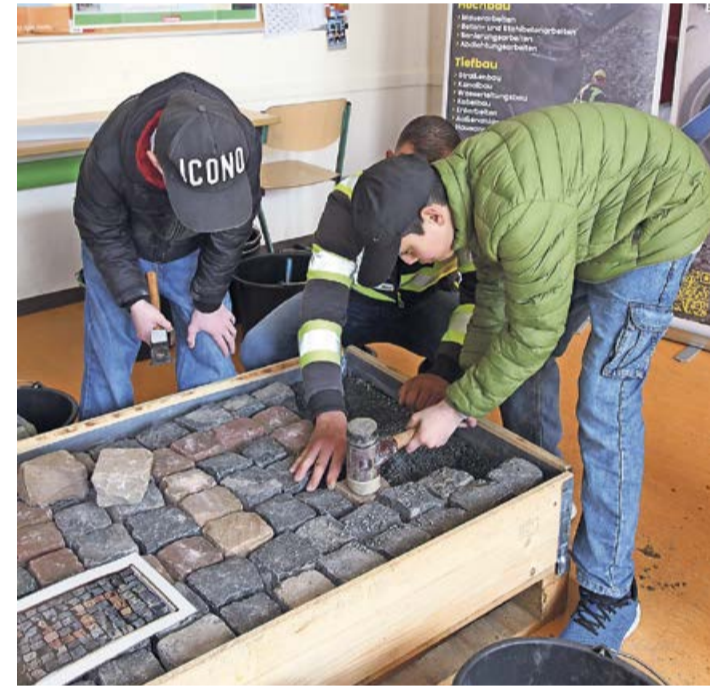
Mit dem Titel der bekannten TV-Comedyserie „Hör' mal, wer da hämmert!“ könnte man dieses Bild beschriften. Spaß hat es den Jugendlichen aber auf jeden Fall gemacht – wann kann man in einem Klassenzimmer schon mal so ein schönes Straßenpflaster verlegen?