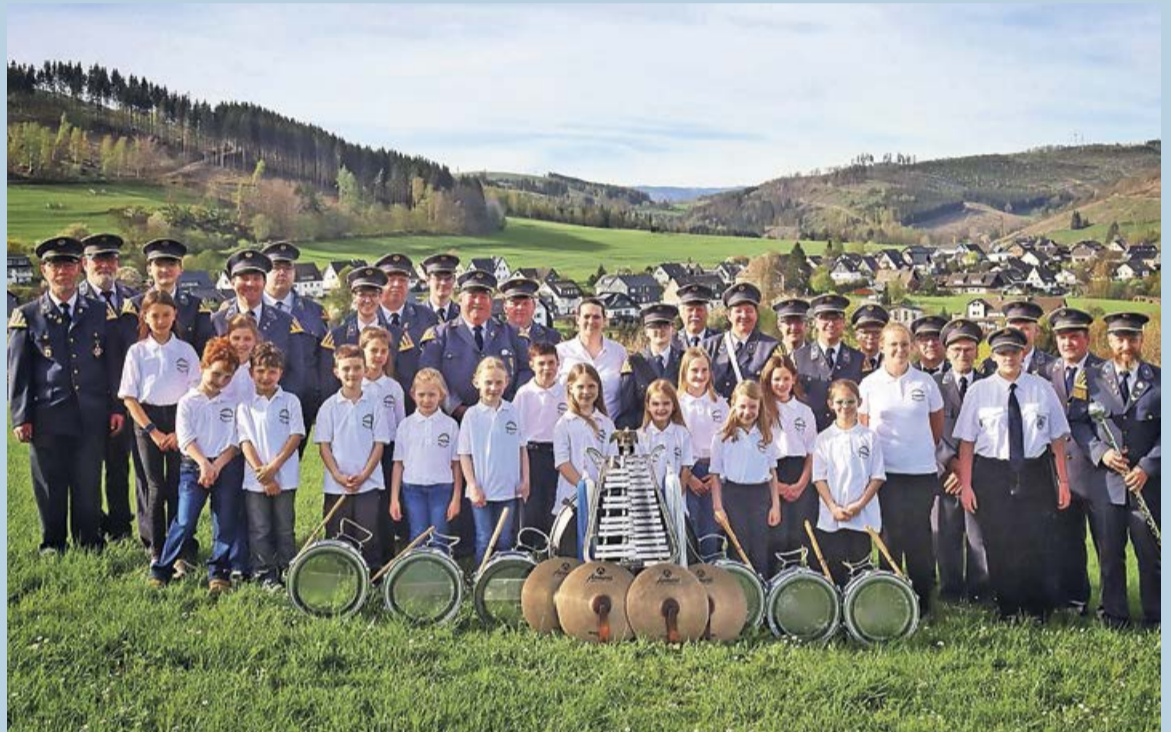
Das Tambourkorps „Wittgenstein“ Dotzlar feiert in diesem Jahr sein 100-jähriges Bestehen. Hatte man in 1924 noch mit neun jungen Männern angefangen, kann man heute auf eine Vielzahl von Musikerinnen und Musikern bauen.

beendet hatten, gründeten in einer wirtschaftlich schwierigen Zeit das Tambourkorps „Wittgenstein“ Dotzlar. Doch allen Widrigkeiten zum Trotz wurden