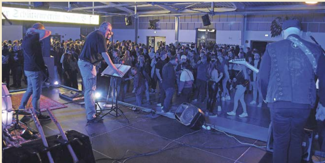
Bei der Nacht der Nächte 2.0 in 2023 haben „Grandmamas Backside“ die Halle schon komplett gefüllt. Dieses Jahr möchte man an den Erfolg aus dem Vorjahr anknüpfen und hat wieder ein vielversprechendes Programm auf die Beine gestellt.