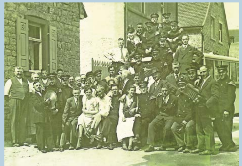
Das Dotzlarer Tambourkorps bei einem Ausflug in Eppelsheim in 1935.