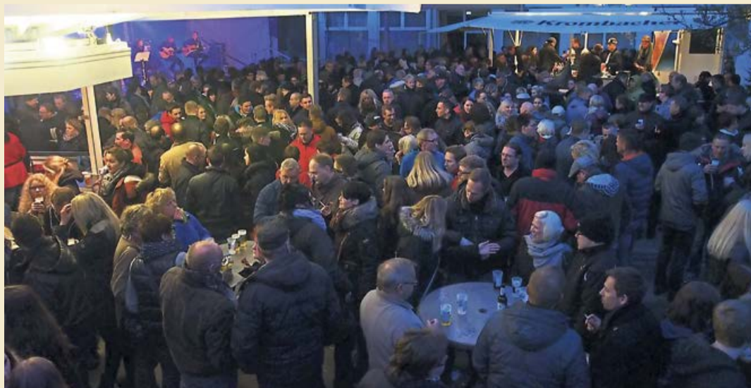
Mit „Mai-Baum-Rock“. Rockklängen der 70er und 80er muss man rechnen, wenn es heute Abend wieder heißt: Nacht der Nächte in Erndtebrück. Diesmal wird in der Schützenhalle in Erndtebrück gefeiert.