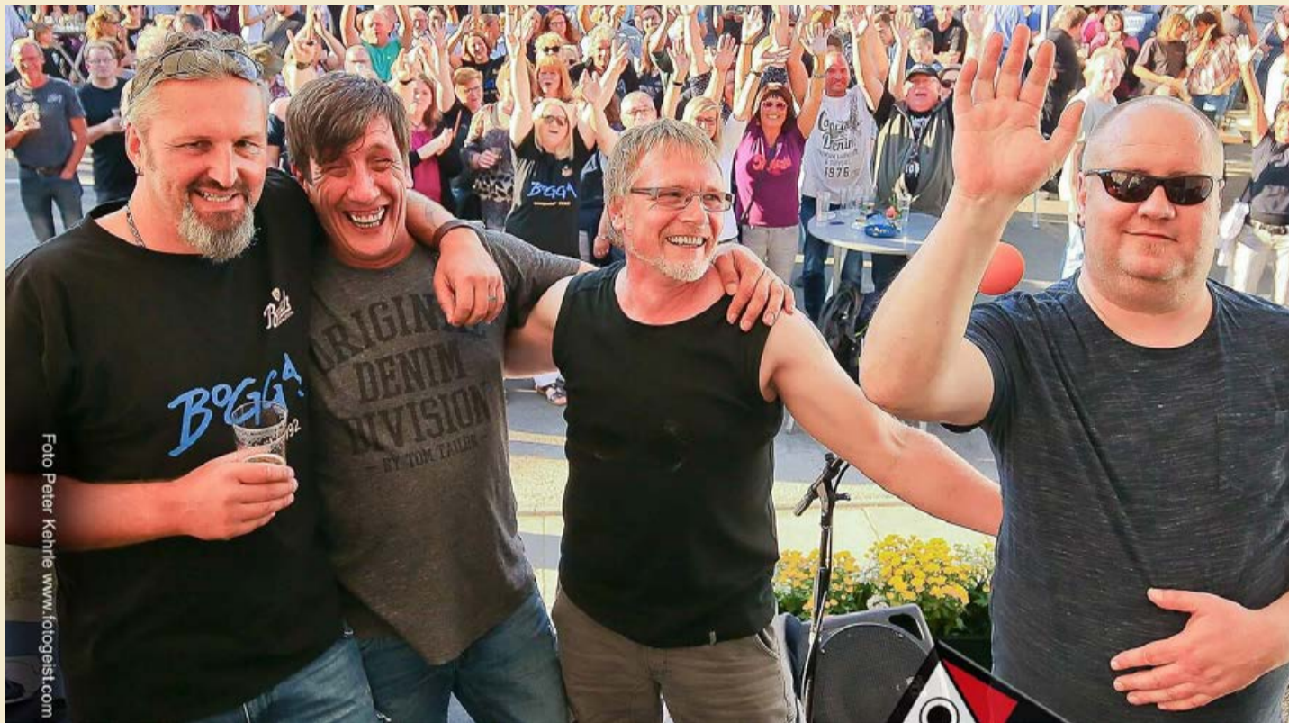
Bekannt sind sie in ganz Wittgenstein und darüber hinaus: „BoGGA“ wird beim Maibaumrock ordentlich einheizen. Mit einem großen Sortiment an eigenen Liedern wird eine gute Stimmung garantiert sein.