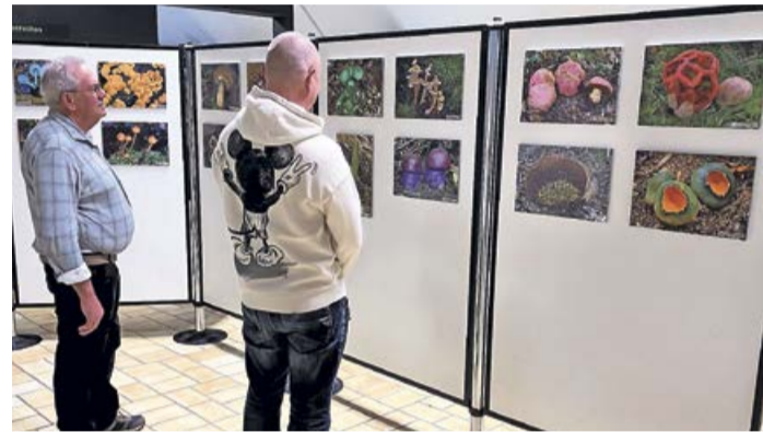
Bei der Sonderausstellung „Pilze aus aller Welt“ kann man sich farnefrohe Fotografien von Pilzen aus unterschiedlichen Ländern ansehen.

Bad Laasphe. Im Pilzkundemuseum Bad Laasphe wird ab Sonntag, 5. Mai, die Sonderausstellung „Pilze aus aller Welt“ zu sehen sein. Die Ausstellung zeigt tolle Pilzfotografien von skurrilen, seltenen oder einfach nur wunderschönen Pilzen aus den unterschiedlichsten Ländern. Hierfür haben Mitglieder des Fördervereins „Freunde und Förderer der Pilzkunde“ Bilder von ihren Reisen zur Verfügung gestellt, so dass Pilzarten von allen Kontinenten vertreten sind. Ob es der „Wüsten-Stäubling“ aus Benin, der „Violette Flaumpilz“ aus