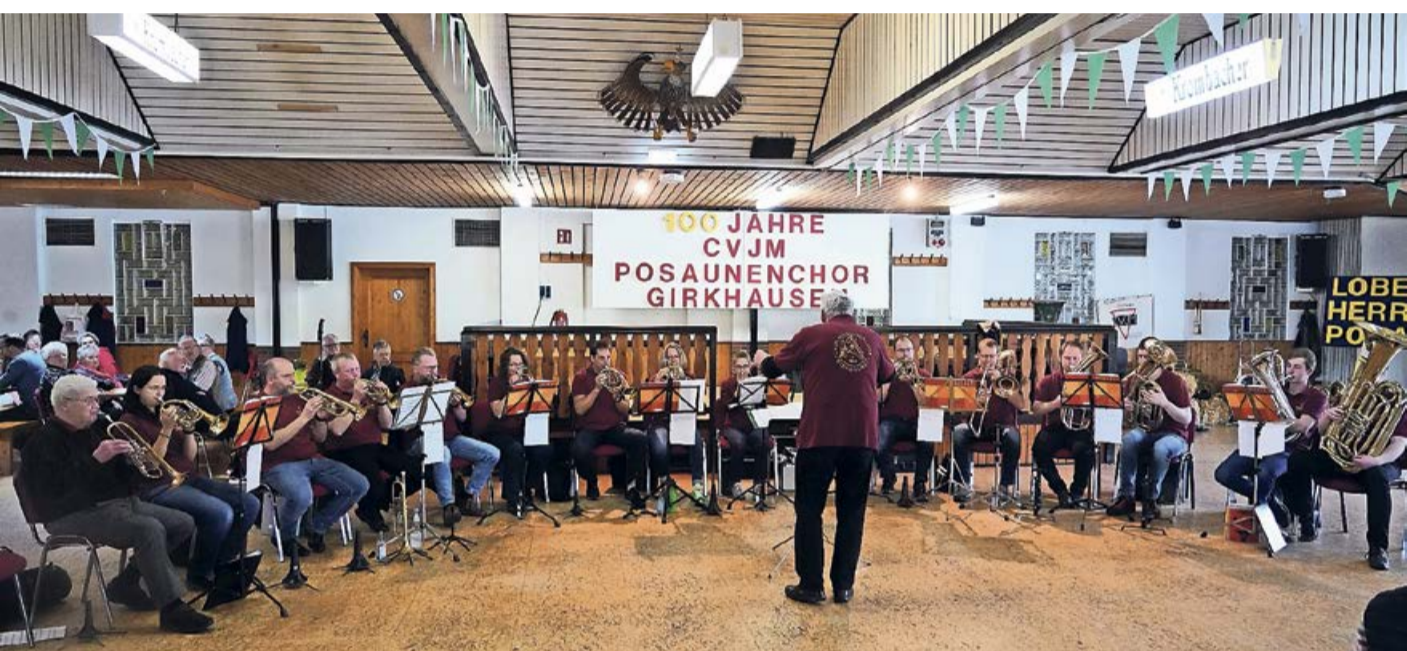
Beim Volkslieder-Nachmittag anlässlich des 100-jährigen Jubiläums des CVJM Posaunenchores konnten sich die Gäste über ein starkes Klangvolumen und gute Musik freuen.

Girkhausen. Wie aus der Chronik zum 75-jährigen Jubiläum zu ersehen ist, war 1924 die Geburtsstunde des CVJM Posaunenchor Girkhausen. Pfarrer Dr. Müller stiftete die ersten Instrumente und man konnte eine erfolgreiche Arbeit starten. Zunächst standen aber enorme Schwierigkeiten im Raum. Keiner der Aspiranten hatte eine musikalische Vorbildung, geschweige denn hatte man einen Dirigenten und mit den Noten gab es auch so manchen verzweifelten Kampf. Erst einige Zeit später war mit dem „Littfelder Otto“ (Nachname