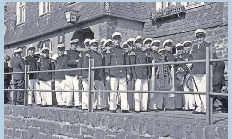
Das Tambourkorps in 1954 bei der Kirmes in Arfeld.

Musik. Am Pfingstamstag, 18. Mai, werden ab 16 Uhr zahlreiche Spielmannszüge und Musikvereine in Dotzlar zum Freundschaftstreffen erwartet. Nach den Bühnenauftritten wird dann mit der Band „Let's Dance“ weitergefeiert. Am Pfingstsonntag können sich die Liebhaber der Blasmusik ab 11 Uhr auf die „Egerländer6“ freuen, die bereits zur 600-Jahr-Feier das Publikum begeistern konnten. Weitere Informationen, unter anderem auch eine Übersicht der teilnehmenden Vereine, findet man auf der Homepage Tambourkorps-Dotzlar.de .