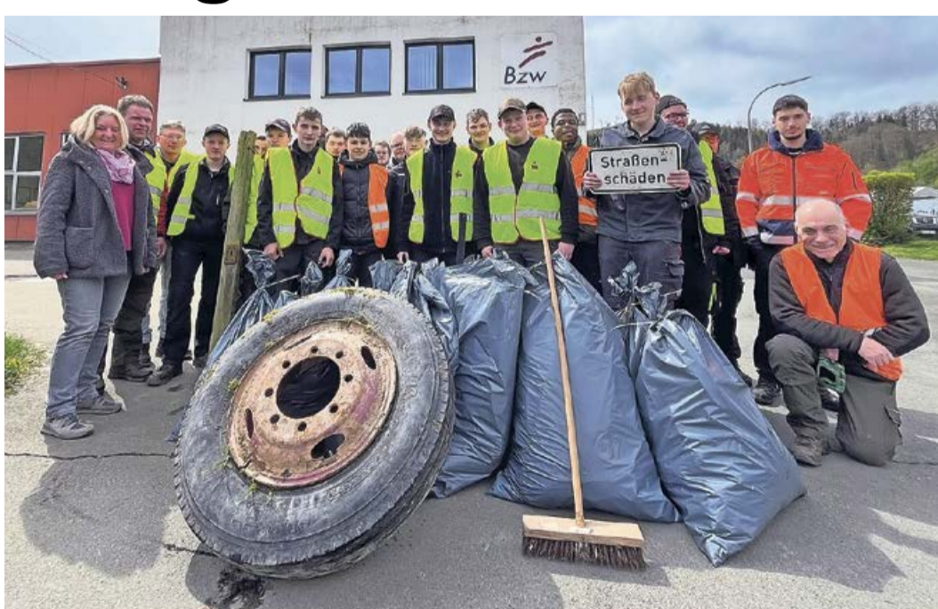
Unter dem Motto der „Dreck soll weg“ im Rahmen der Aktion „Saubere Landschaft“ wurde passend zum Frühling ordentlich in der Bad Berleburger Kernstadt aufgeräumt.