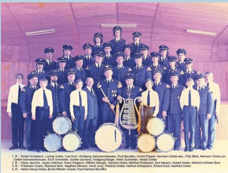
Das Dotzlarer Tambourkorps zu seinem 50. Jubiläum in 1974.