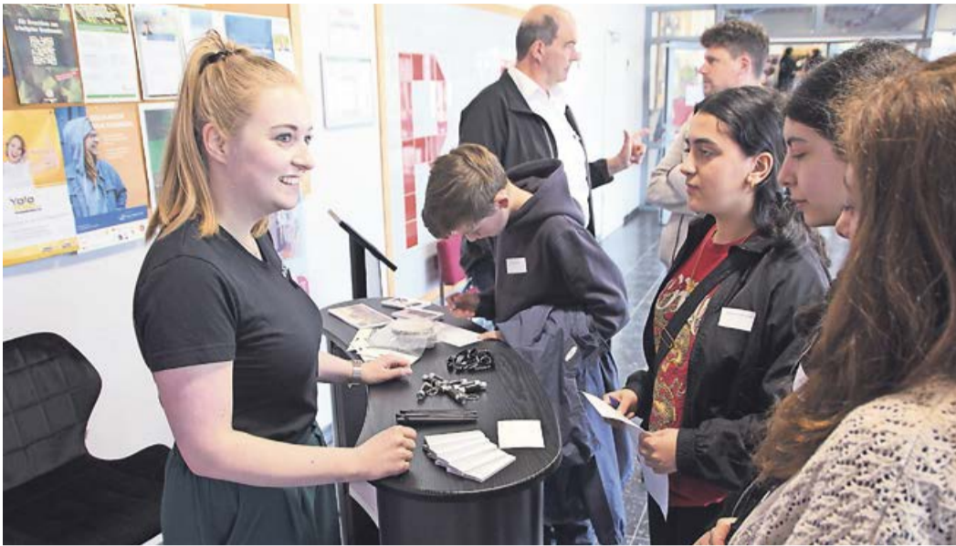
Am Stand von Regupol wurde man nicht nur kompetent beraten, sondern konnte auch auf einer kleinen Minigolfbahn sein Können am Schläger beweisen.