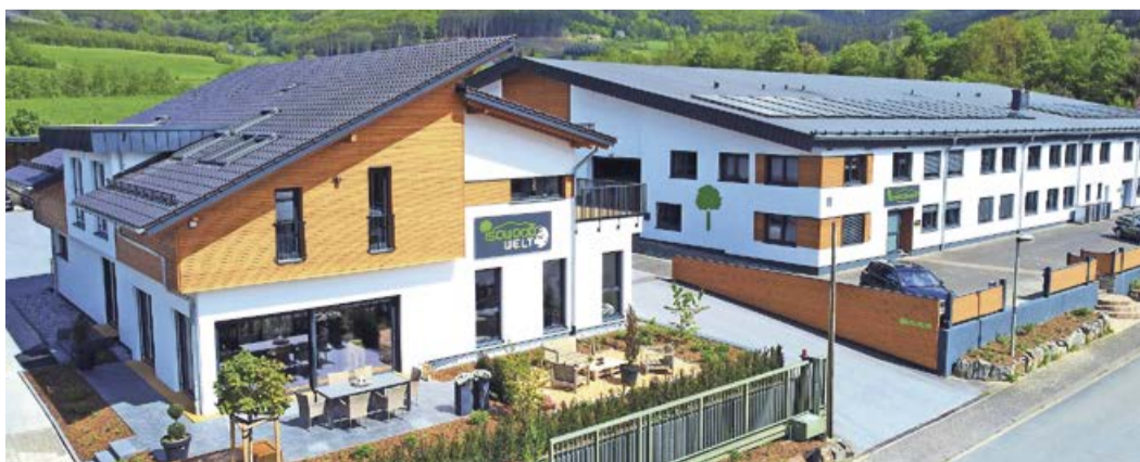
Von 11 bis 17 Uhr haben Besucher die Möglichkeit, sich über verschiedene Aspekte des Hausbaus zu informieren.

Die Welt des ökologischen Hausbaus beim Tag der offenen Tür entdecken