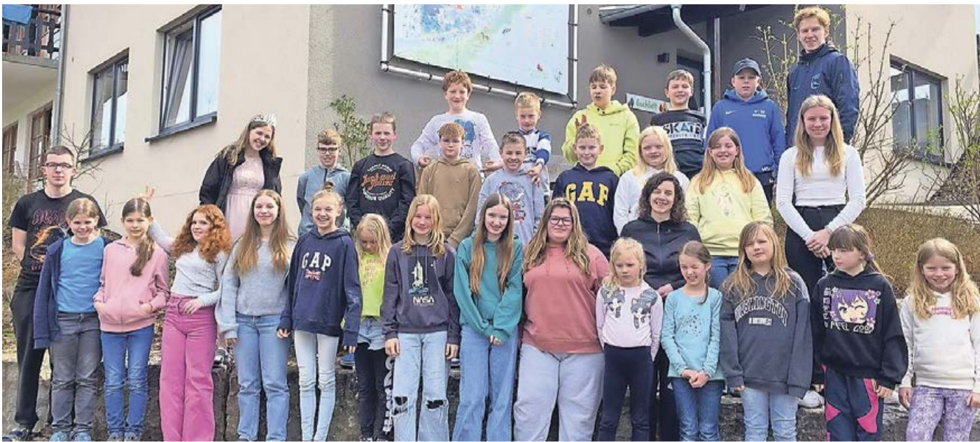
In vier spannenden Bibelarbeiten fanden die Teilnehmer heraus was Super Mario und seine Freude mit der Bibel verbindet.

Wemlighausen. In diesem Jahr fand die Oster-Jungscharenfreizeit des CVJM Wittgenstein im altbewährten Abenteuerdorf in Wemlighausen statt. Die 27 Kinder im Alter von 8 bis 12 Jahren ließen sich nicht vom durchwachsenen Wetter abhalten, das abwechslungsreiche Gelände mit Minigolfplatz, Lama-Ställen, Tischkicker und Billardplatte zu erkunden. In