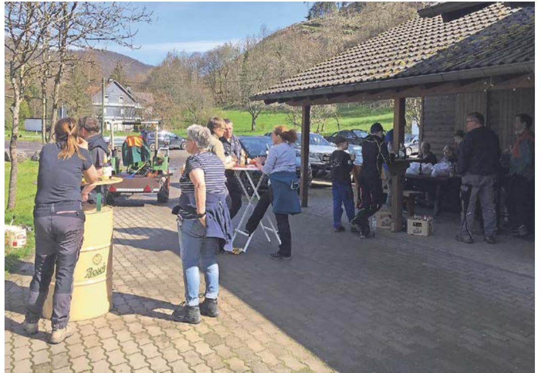
Die Ortsvorsteherin und der Vorsitzende des Vereins bedanken sich nochmals herzlich bei allen Helferinnen und Helfern sowie dem Bauhof der Stadt Bad Laasphe für die Bereitstellung des Anhängers und die Entsorgung des Mülls.