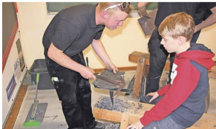
Bei der Firma Schaller konnten die Schülerinnen und Schüler selbst mit dem Dachdeckerwerkzeug umgehen und etwa Herzen aus dem Schiefer schlagen.