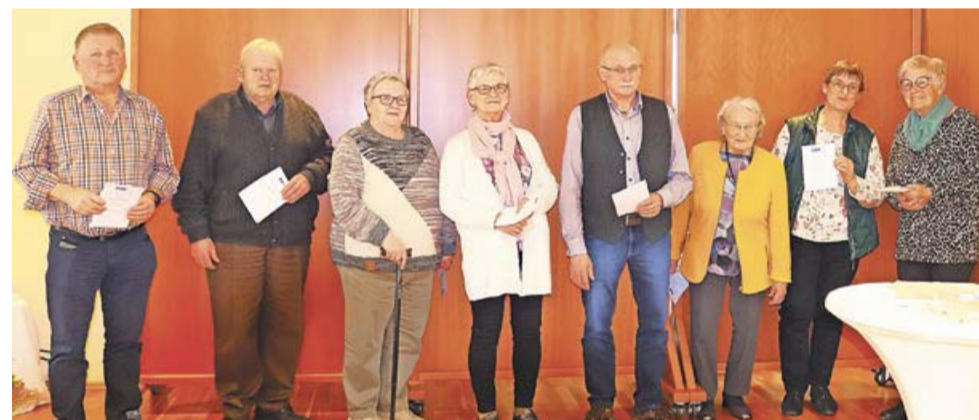
Bei der diesjährigen Jahreshauptversammlung gab es zahlreiche Jubilare für 10 und 25 Jahre aktive Mitgliedschaft im VdK Erndtebrück.