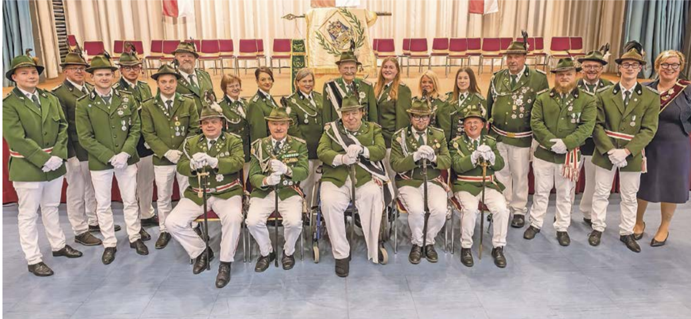
Auf 175 Jahre kann der Bad Laasphe Schützenverein nun zurück blicken. Dies hat der Verein mit einem großen Festkommers getan.

Bad Laasphe. Am vergangenen Samstag veranstaltete der Laasphe Schützenverein einen Festkommers anlässlich seines 175-jährigen Bestehens. Etwa 300 Gäste füllten die Bänke in der Aula des