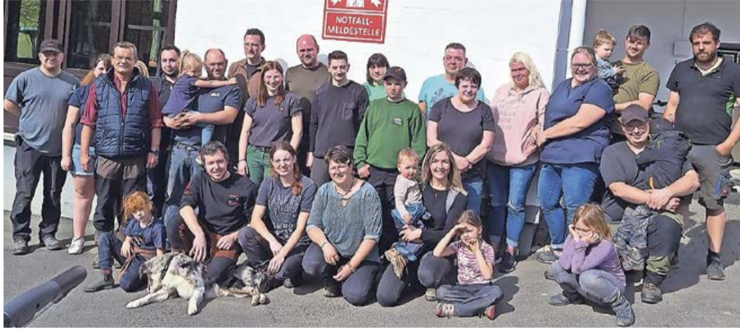
Am Samstag, 13. April, fand in Alertshausen bei frühlingshaften Temperaturen und viel Sonnenschein die Aktion Sauberes Dorf statt. Treff- und Ausgangspunkt sowie Ziel war jeweils das Dorfgemeinschaftshaus. Viele Hände, groß und klein, bedeuteten ein schnelles Ende. Der anschließende gemütliche Ausklang am Grill nahm mehr Zeit in Anspruch.