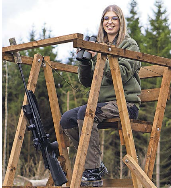
Ein besonderes Highlight des Tages wird der Auftritt des Bläsercorps sein, das mit traditioneller Jagdmusik für eine stimmungsvolle Kulisse sorgen wird.

ein vielseitiges Programm mit kulinarischen Genüssen, einem Rundgang durch die Musterausstellung von Holz & Raum sowie einer Führung, die Einblicke in die neuesten Trends und Produkte bietet. Ein besonderes Highlight des Tages wird der Auftritt des Bläsercorps sein, das mit traditioneller Jagdmusik für eine stimmungsvolle Kulisse sorgen wird. Darüber hinaus haben Besucher die Möglichkeit, von speziellen Angeboten und attraktiven Rabatten auf ausgewählte Produkte zu profitieren. „Wir sind stolz darauf,