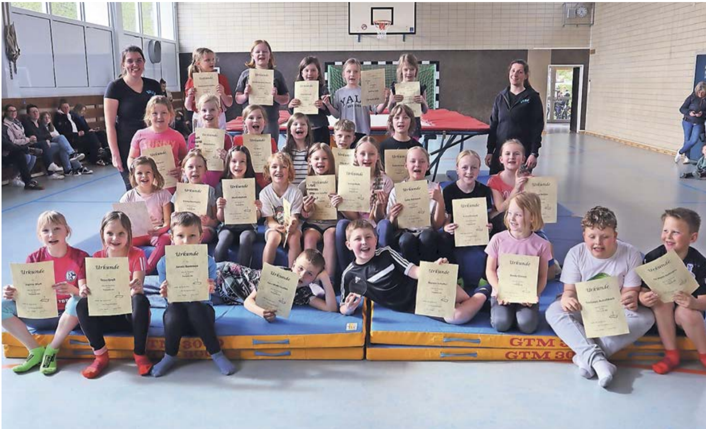
Besonders gefreut haben sich die Kinder über ihre Urkunden zur Teilnahme an der Trampolin-AG.

Banfe. Am vergangenen Mittwoch, 10. April, fand in der Turnhalle der Banfetschule ein beeindruckendes Ereignis statt: Die Schüler und Schülerinnen der freiwilligen Schulsportgemeinschaft präsentierten stolz ihre erlernten Fähigkeiten beim Tisch-Trampolinspringen vor ihren Eltern und der Schulgemeinde. Die Tisch-Trampolinführung markierte den Abschluss eines erfolgreichen Schuljahres, in dem die Teilnehmerinnen und Teilnehmer regelmäßig zur Übungsstunde zusammenkamen, um ihre Fähigkeiten im Trampolinspringen zu verbessern. Unter der Leitung von Jen-