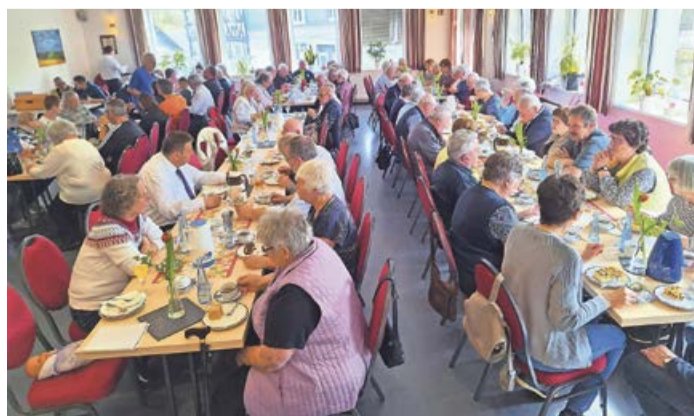
Der Sängerbund Raumland kann als Gastgeber des Frühlingsfestes sehr zufrieden sein. So waren die Plätze im großen Saal immer besetzt, wenn der Weg nicht gerade zum Kuchenbuffet oder zum Würstchengrill führte.

was mit großem Applaus in dem bis auf den letzten Platz gefüllten großen Saal honoriert wurde. Ein weiterer musikalischer Höhepunkt des Frühlingsfestes war dann letztlich der Auftritt des bekannten Folktrios „Peelsound“. Als recht angenehm aus Sicht der Besucher wurde übrigens die Tatsache empfunden, dass nicht ein Programmpunkt den nächsten gejagt hat. „Die Pausen waren in ihrer Länge genau richtig“, lobte ein Ehepaar. „So hatte man auch mal die Gelegenheit für ein paar gute Gespräche, ohne einen der schönen Programmpunkte zu versäumen. Auch das gehört zu einer guten, funktionierenden Gemeinschaft dazu!“ waren sich nicht nur diese Eheleute sicher.