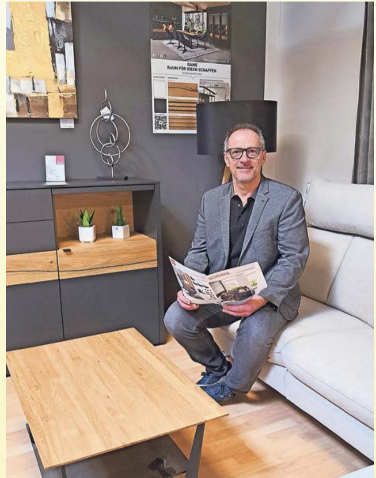
Erhältlich sind die modernen Polstermöbel in Stoff oder Leder, sowie dazu passende Couchtische in vielen Stilrichtungen.

Battenfeld. Wohnen steht für Freude und Lebensqualität. Für individuelle Gemütlichkeit und Entspannung findet man bei Möbel Schiemann eine vielfältige Auswahl an Sitzmöbeln, ausgestattet mit höchstem Sitzkomfort und zahlreichen Funktionen. Erhältlich sind die modernen Polstermöbel in Stoff oder Leder, sowie dazu passende Couchtische in vielen Stilrichtungen. Zur Frühlingsschau werden die neuen Ess-