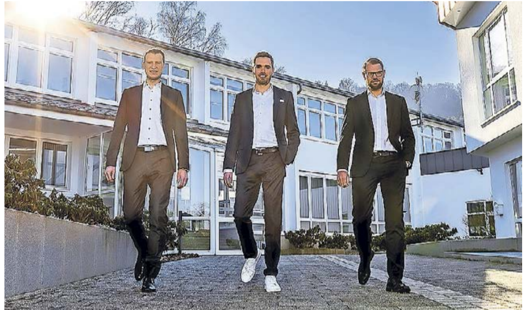
Die Geschäftsführung von REGUPOL freut sich über die Auszeichnung als Weltmarktführer im Bereich des Upcyclings von elastischen Materialien.