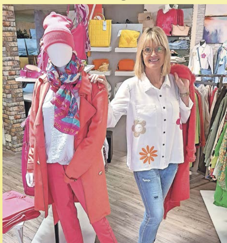
Die außergewöhnliche Schmuckkollektion für Sie und Ihn lassen keine Wünsche offen.

Battenfeld. Bei Tandeco gibt eine Fülle schöner Dinge zu entdecken. Die modebewusste Frau findet in der farbenfrohen Modekollektion ihr Lieblingsoutfit, die besonderen Modeaccessoires wie Handtaschen und Halstücher unterstreichen jeden Look. Die außergewöhnliche Schmuckkollektion für Sie und Ihn lassen keine Wünsche offen. Individuelle Geschenk-Ideen zu besonderen Anlässen wie Konfirmation, Muttertag, Hochzeit und Geburtstag findet man in großer Auswahl, die liebevolle Geschenkverpackung wird gern übernommen. Für ein schönes Zuhause werden die neuesten Bilder- und Dekorationstrends gezeigt. Die Auswahl an kulinarischem ob süß oder herzhaft ergänzt das schöne Sortiment. Zur Frühlingsschau gibt es eine besondere Tandeco-Aktion. Samstag und Sonntag erhält man auf das gesamte Sortiment einen Preisnachlass von 10%.