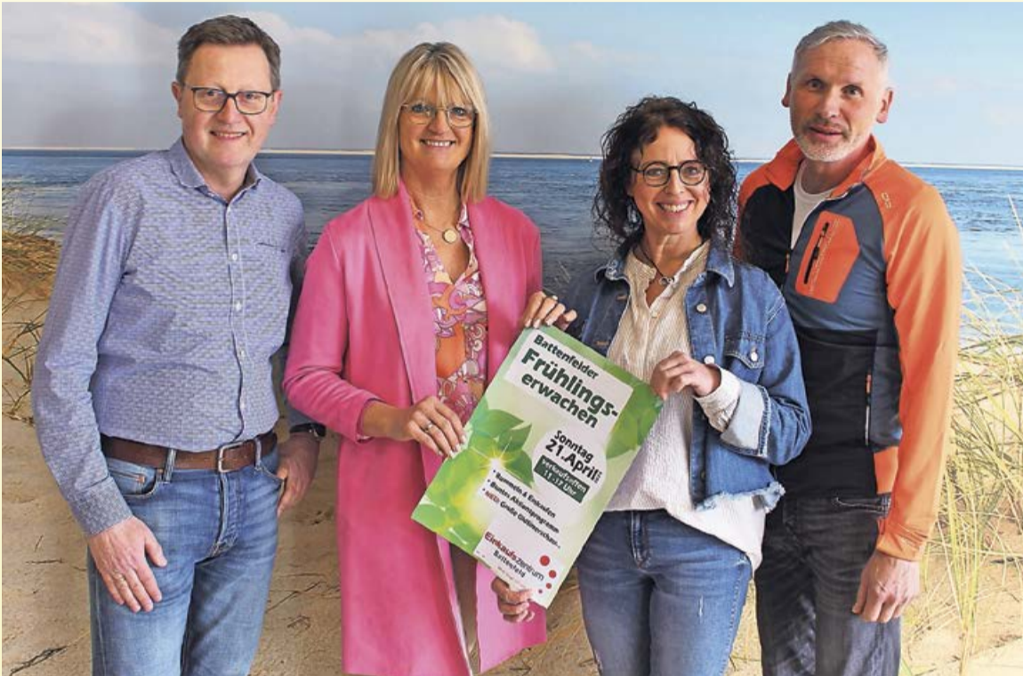
Das Einkaufszentrum Battenfeld lädt herzlich ein. Sonntag findet die Frühlingsschau statt.