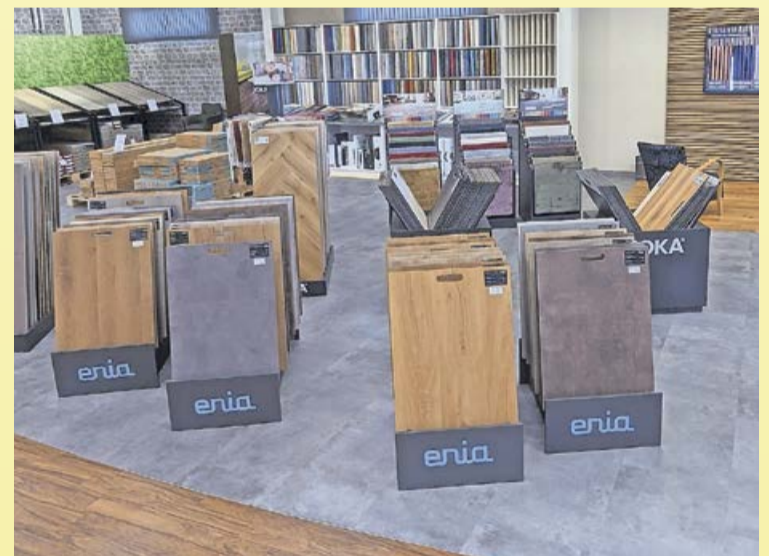
Für schnell Entschlossene gibt es ein umfassendes Sortiment an Lagerware die gleich mitgenommen werden kann.

wird es einen Outdoorbereich geben bei denen die Kunden Markisen, Insektenschutz, Sonnenschutz und Outdoormatten bekommen. Als Handwerksbetrieb für Malerarbeiten und Raumausstattung können alle Arbeiten rund um die angebotenen Produkte auch fachgerecht ausgeführt werden. In der Gardinenabteilung mit eigenem Nähatelier werden Vorhänge nach ihren persönlichen Wünschen gefertigt. Das Team von Henkel Heimdecor freut sich über viele interessierte Besucher.