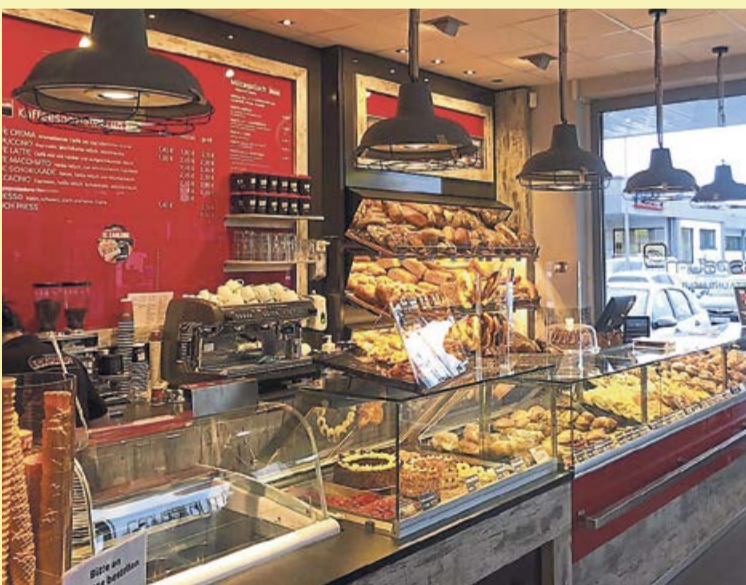
Der Genussraum in Battenfeld.

Battenfeld. ...und das gilt auch für die Filiale der Hatzfelder Traditionsbäckerei Eckhardt im Einkaufszentrum Battenfeld.