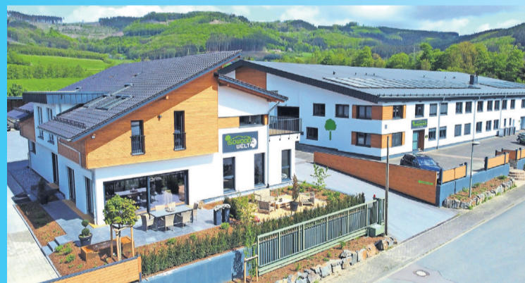
Von 11 bis 17 Uhr haben Besucher die Möglichkeit, sich über verschiedene Aspekte des Hausbaus zu informieren.

Finnentrop. SOWOODHAUS lädt am Sonntag, 21. April, zu einem besonderen Tag der offenen Tür ein, der einen Einblick in ökologischen und nachhaltigen Hausbau verspricht. Von