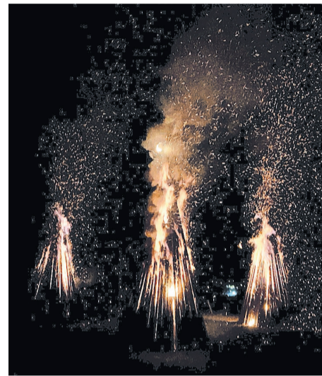
Wie in den Jahren zuvor, machten sich auch dieses Jahr einige Wittgensteiner nach Rückerhausen.