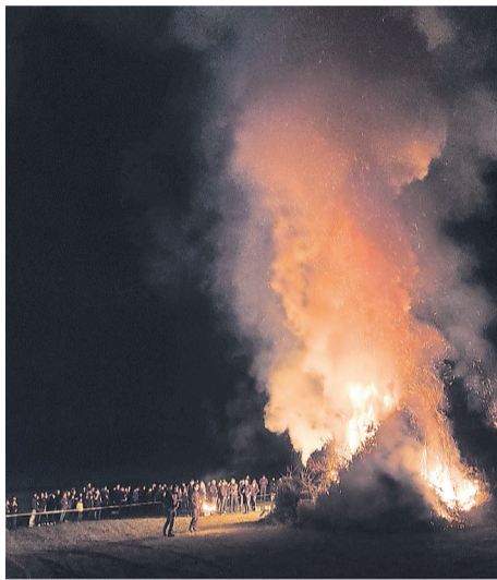
Für Getränke und Leckereien vom Grill sorgte selbstverständlich die Dorfjugend Schameder.