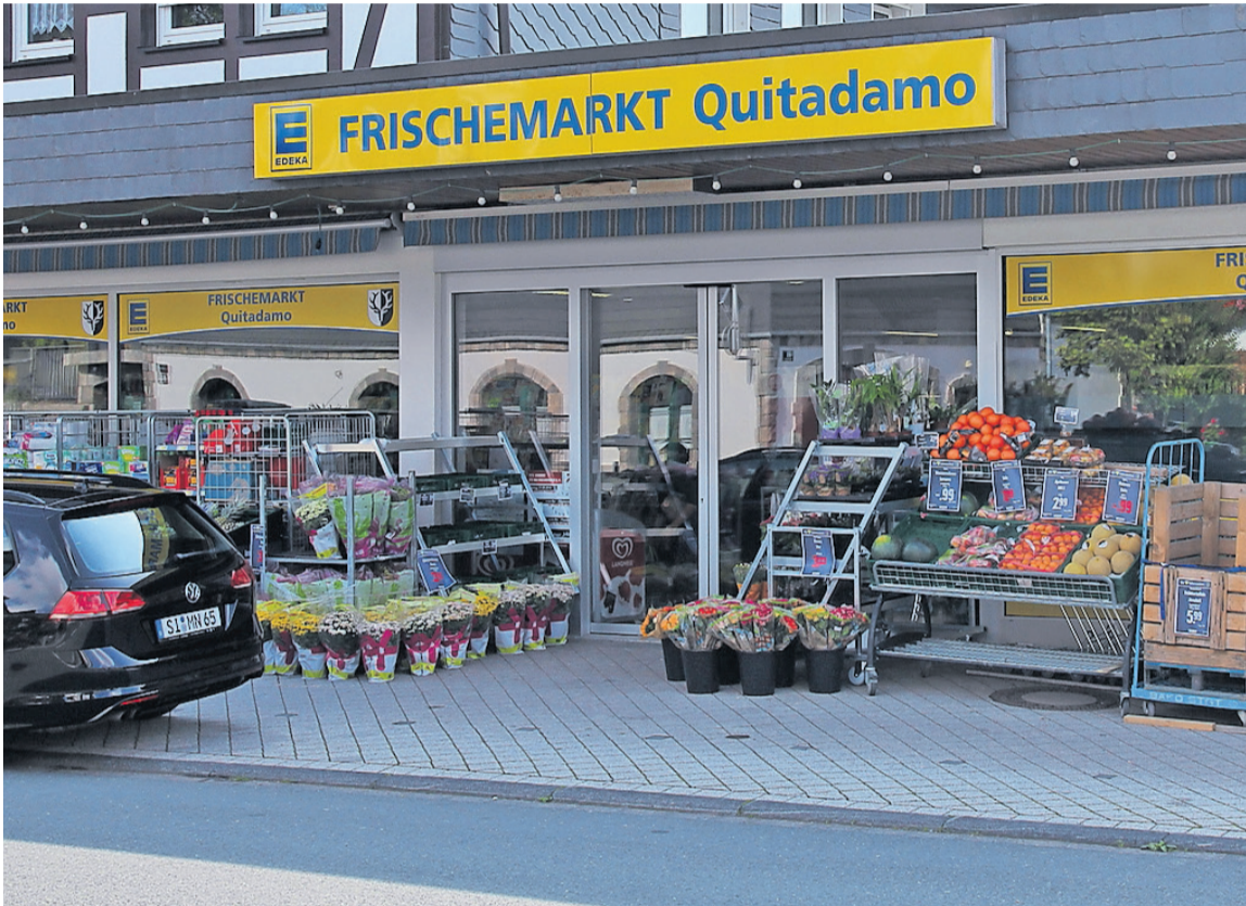
Der Quitadamo Frischemarkt in Feudingen bietet seinen Kunden auch einen wöchentlich wechselnden Menüplan mit leckeren Speisen an.

Edeka-Markt Quitadamo bietet neben dem üblichen Service auch Mittagsmenüs