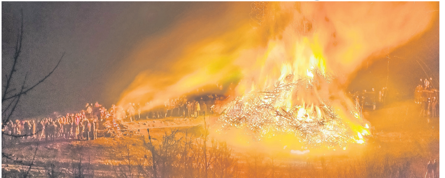
Das Osterfeuer auf der Lenne war auch in diesem Jahr wieder sehr gut besucht.