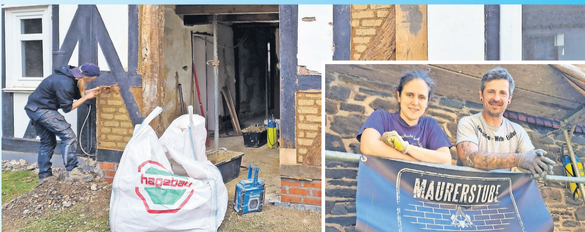
Die Maurerstube ist stolz darauf, die Besonderheiten traditioneller Handwerkskunst zu bewahren, sei es das Bearbeiten von Natursteinen oder das Herstellen von Mörteln.

Richstein. Die Maurerstube, ein Unternehmen, das seinem Namen alle Ehre macht, legt den Fokus auf Maurerarbeiten aller Art. Neben dem klassischen Mauern mit Ziegel- und Naturstein bietet das Unternehmen ein breites Leistungsspektrum, darunter Restaurierungen, Bauwerkhalterung und -instandsetzung, Bogen- und Gewölbebau sowie statische Sicherungen und Betonsanierungen an historischen Denkmälern. Neben