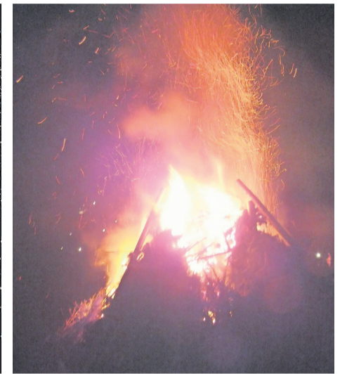
Auch in Schwarzenau besuchten zahlreiche Familien das Osterfeuer am Osterwochenende.

Bei den auf dieser Seite werbenden Betrieben können Sie mit der Bonuspunkt-Karte punkten