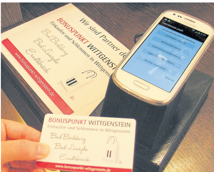
Die Kunden bekommen ihre persönliche Karte bei allen Partnern der BONUSPUNKT Wittgenstein-Karte.

Wittgenstein. Es gibt mittlerweile 55 Akzeptanzstellen in ganz Wittgenstein (Bad Berleburg, Bad Laasphe, Erndtebrück), in denen man seine Punkte sammeln kann. Die große Akzeptanz der BONUSPUNKT Wittgenstein-Karte verdeutlichen die hohen Buchungszahlen, die zeigen, dass die Karten 1.500 bis 3.500 Mal pro Tag von den Kunden genutzt wird.