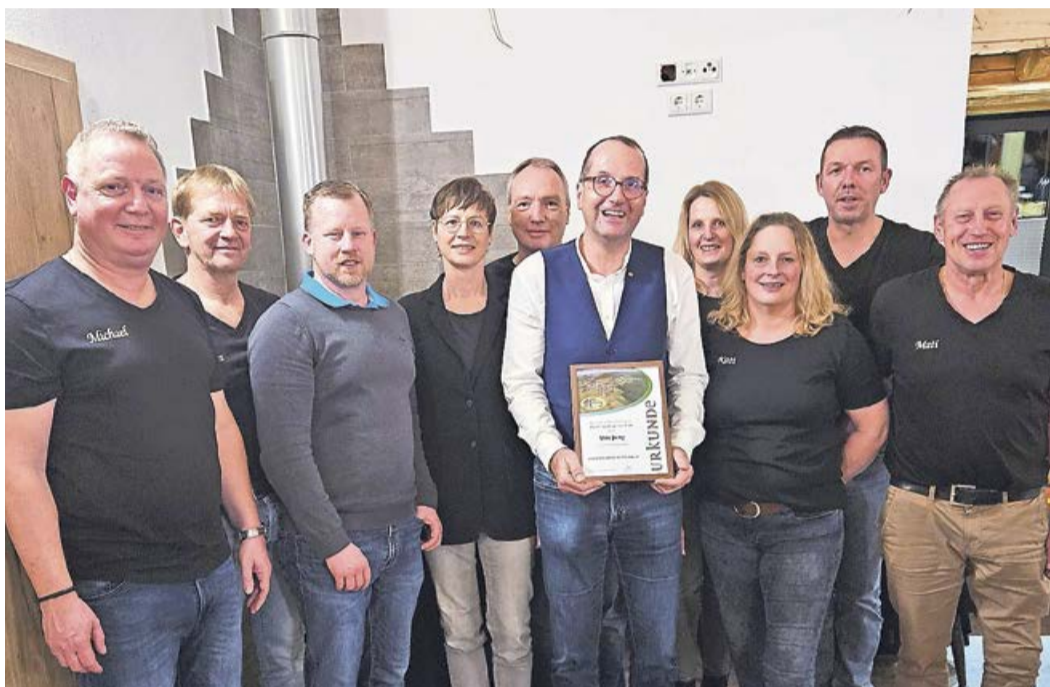
Neben ganz viel Leidenschaft und Herzblut haben die Mitglieder fast 5.000 Arbeitsstunden eigenverantwortlich und ehrenamtlich in die Heimatstuwwe investiert.