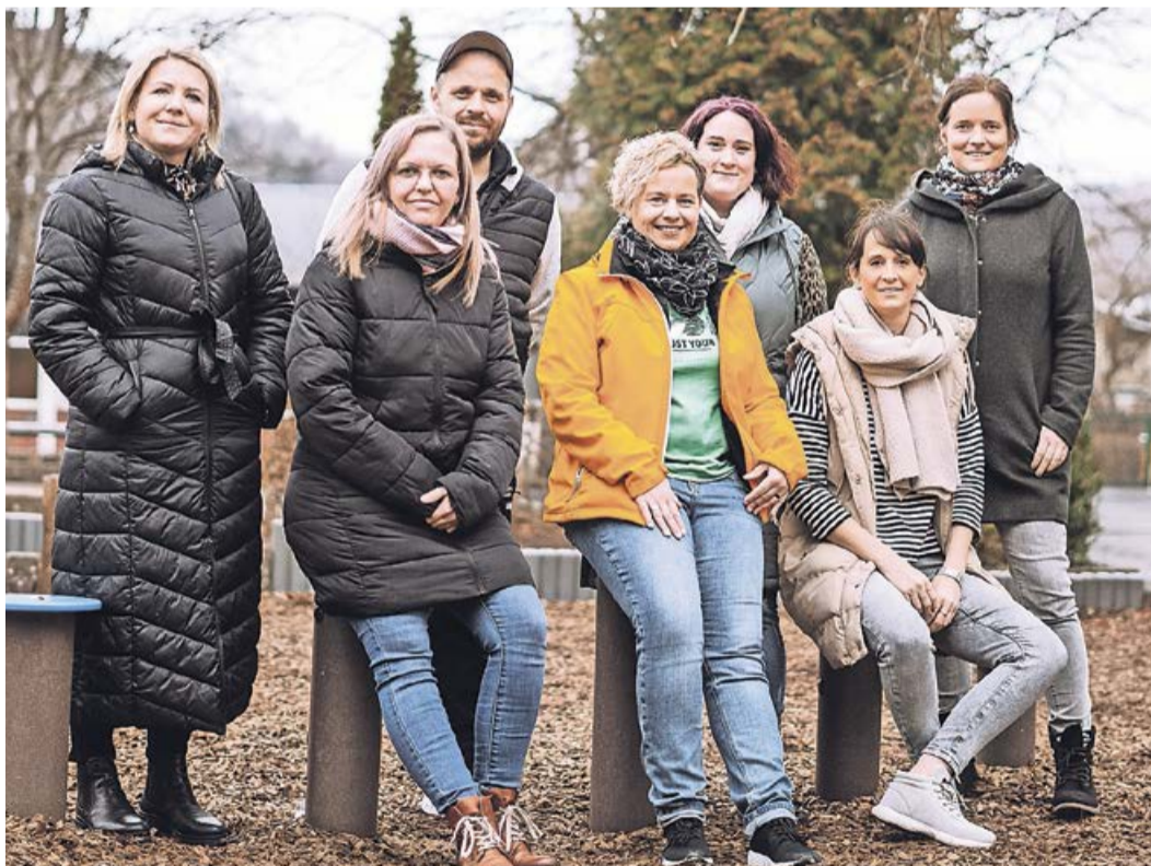
Am 7. September plant der Verein ein Sommerfest auf dem Schulhof der Grundschule von 11 bis 15 Uhr.

1. Vorsitzender verabschiedet, neuer Vorstand gewählt