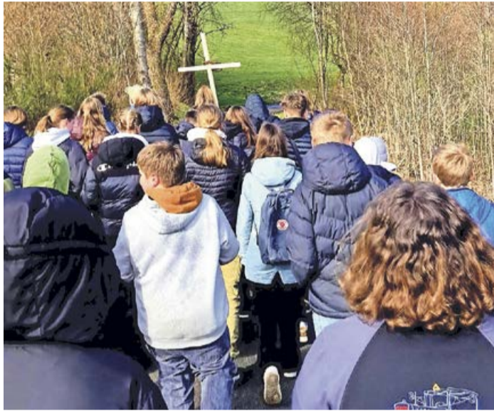
An verschiedenen Stationen entlang der Wiesenwege gibt es unterwegs kleine Impulse zu den letzten Stunden im Leben von Jesus.

Erndtebrück. Der ökumenische Kreuzweg der Kirchengemeinden Erndtebrück und Birkelbach findet auch dieses Jahr wieder in der Passionszeit statt: Treffpunkt ist am Dienstag, 26. März, um 15 Uhr an der Ev. Kirche Erndtebrück. Eingeladen sind alle (Jung und Alt), die an einer gemeinsamen Wanderung von