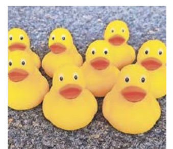
Die erworbenen Enten müssen von den Käufern am Aktionstag bis spätestens 12.30 Uhr am Stand der DLRG in der Stockwiese abgegeben werden.

holt und die Sieger ermittelt. Die schnellsten sechs Enten gewinnen und werden aus dem Rennen genommen. Alle anderen Enten werden eingesammelt und zum Startpunkt zurückgebracht, um automatisch an Lauf 2 um 14.30 Uhr teilzunehmen. Die Betreuung des Streckenverlauf übernimmt die DLRG Ortsgruppe Bad Laasphe, so dass gewährleistet ist, dass alle Enten bestmöglich bis zum Ziel kommen und nicht am Ufer oder Steinen hängen bleiben. Um 15.30 Uhr wird es vor dem Wittgensteiner Möbelhaus eine Siegerehrung und Preisvergabe für 12 Sieger geben, den jeweils schnellsten 6 aus Lauf 1 und 2. Bei Nichterscheinen erlischt der Gewinnanspruch und der Preis wird an die nachfolgenden Besitzer der eingegangenen Enten weitergegeben. Auf die Sieger warten Preise im Wert von 1.000 €, unter anderem Tickets für die ausgebuchten Konzerte der Fantastischen Vier bei Kultur Pur, Bad Laasphe Geschenk Gutscheine, Sachpreise uvm. Unabhängig vom Eintreffen im Ziel wird es auch einen ganz besonderen Preis geben. Den, für die originellste Ente, die abgegeben wird. Ob bemalt, beklebt, geschmückt, kostümiert. Hier ist der Fantasie keine Grenze gesetzt, nur so viel sei verrä-