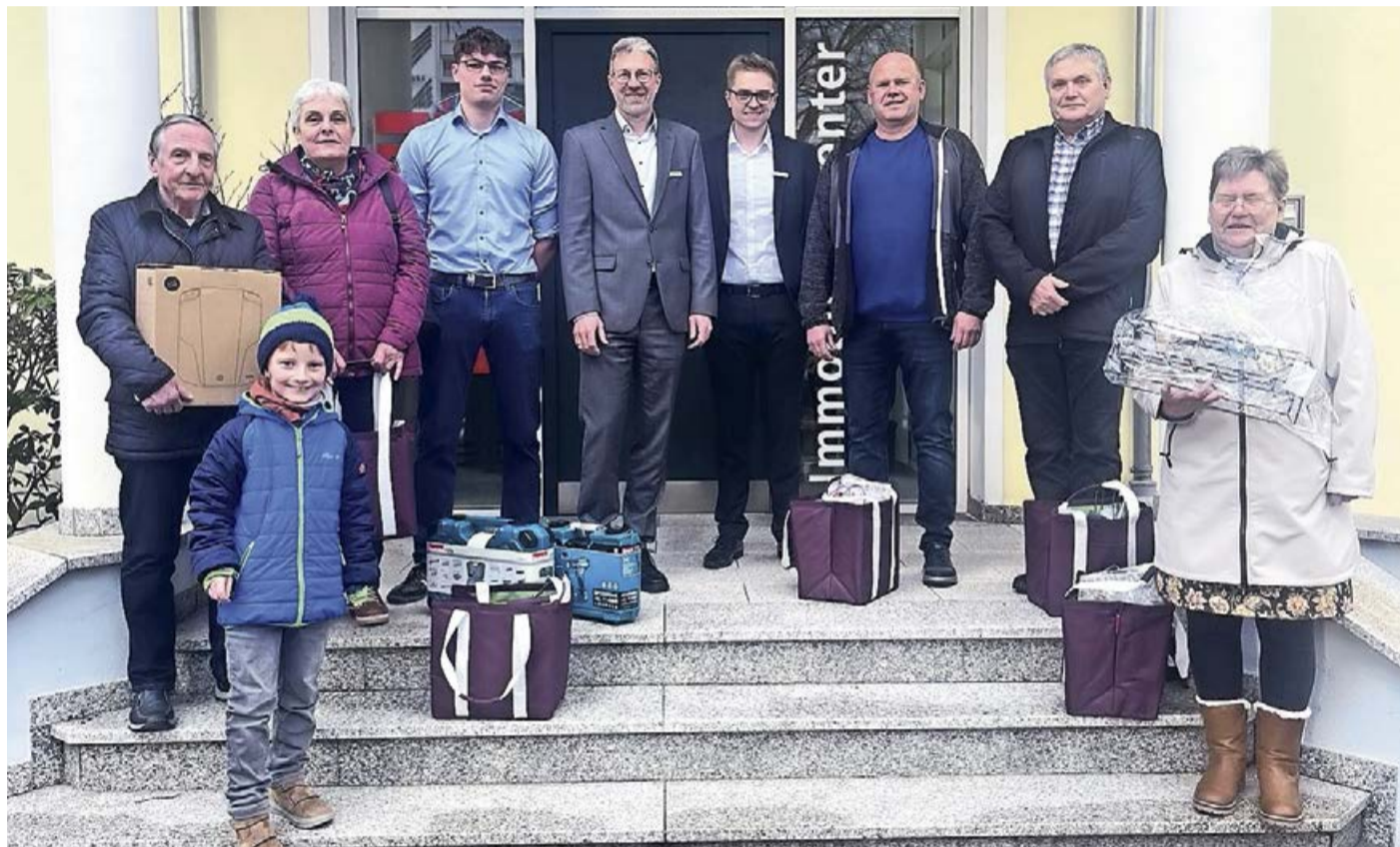
Die stolzen Gewinner des offiziellen Messe-Gewinnspiels zur 15. Sparkassen-Immobilien-Messe.

Strahlende Gesichter bei der Siegerehrung des Gewinnspiels zur 15. Sparkasse-ImmobilienMesse