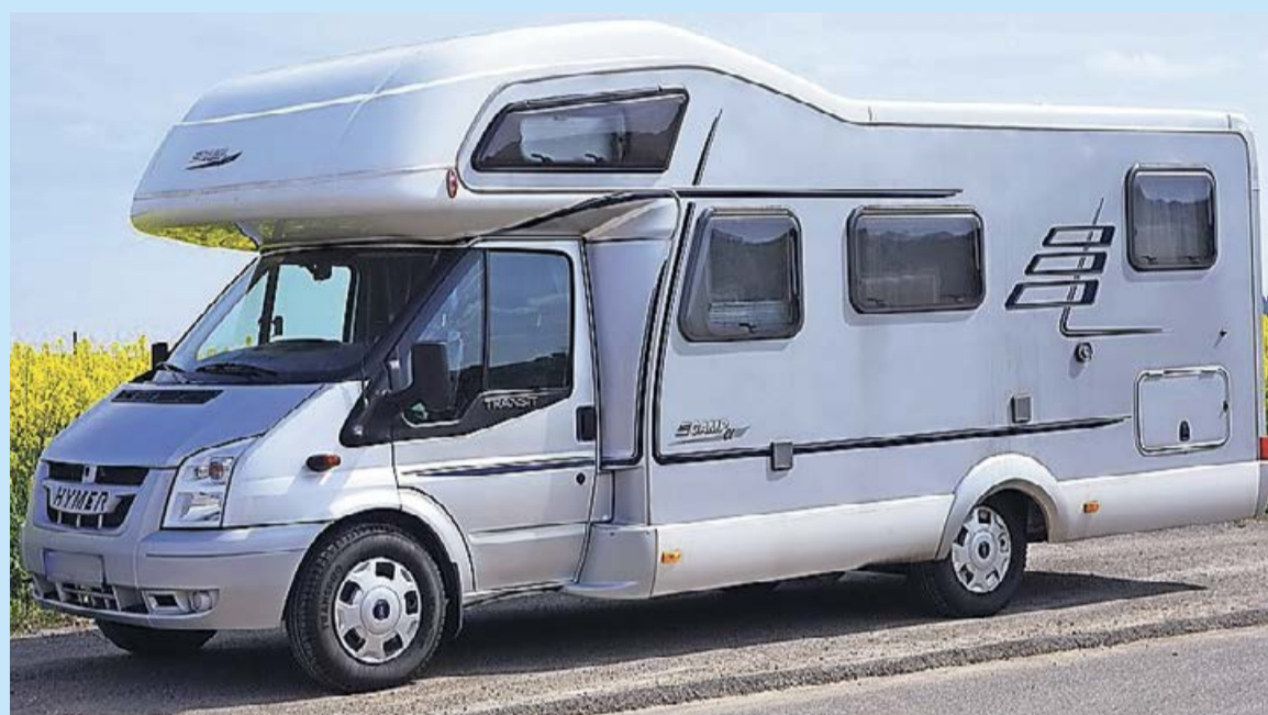
Mit Wohnmobil und Wohnwagen kann man sich auch unterwegs wie zuhause fühlen.

Die große Freiheit genießen und sich trotzdem wie zu Hause fühlen – mit Wohnmobil und Wohnwagen kann dieser Spagat funktionieren. Damit unterwegs weder Panne noch Unfall das Erlebnis trüben, gilt es aber, sich gut vorzubereiten. „Wohnmobil oder Wohnanhänger abholen, einpacken und gleich auf große Fahrt gehen, ist nur für die Wenigsten ein sinnvoller Start in den Urlaub“, sagt Markus Egelhaaf, Unfallforscher bei DEKRA.