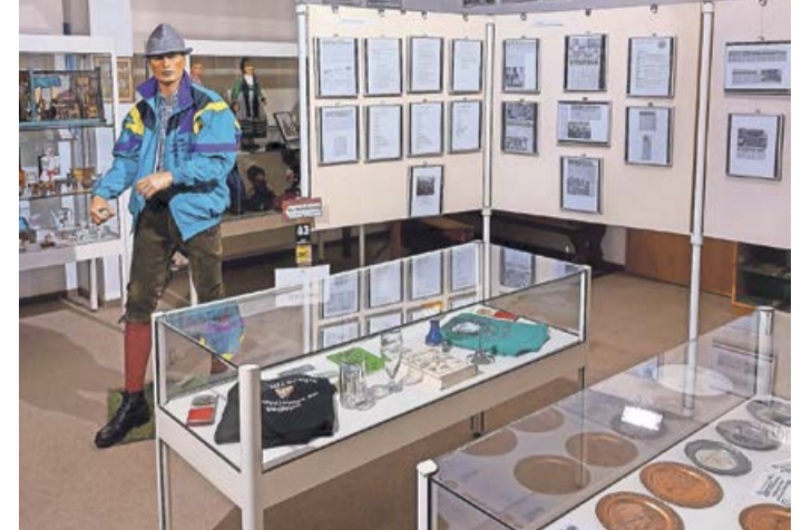
Die Sonderausstellung zum 50-jährigen Bestehen der Wander- und Heimatfreunde Banfetal kann weiterhin besichtigt werden.

Banf. Am Sonntag, 3. März, ist das Heimatmuseum Banfetal inklusive Ostdeutscher Heimatstube bei freiem Eintritt zwischen 14 und 17 Uhr geöffnet. Die Sonderausstellung zum 50-jährigen Bestehen der Wander- und Heimatfreunde Banfetal kann weiterhin besichtigt werden. Mit Bildern, Texten und Exponaten werden die vergangenen 50 Jahre Vereinsgeschichte noch einmal anschaulich dargestellt. Während der gesamten Öffnungszeiten läuft eine Diaschau mit Bildern von zahlreichen Veranstaltungen der Wander- und Heimatfreunde und ein Film, der anlässlich der Eröffnung des Otto-Dörr-Wegs