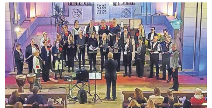
Die Chöre TonRebellion und Singsation laden am Samstag, 16. März, zum Konzert ein.

Bad Berleburg. Was haben Queen, Deep Purple, Rolling Stones, Aerosmith, Metallica, Supertramp, Coldplay, die Münchner Freiheit, John Miles, Cyndie Lauper, Stevie Wonder und Pharell Williams gemeinsam? Sie haben alle so tolle Songs geschrieben, dass sie unbedingt Bestandteil des großen Chorkonzerts „Singsationelle Lieblingslieder“ werden müssen! Die Chöre TonRebellion aus Siegen und Singsation aus Bad Berleburg präsentieren dieses mitreißende Konzert am Samstag, 16. März, um 19.30 Uhr im Bürgerhaus am Markt in Bad Berleburg.