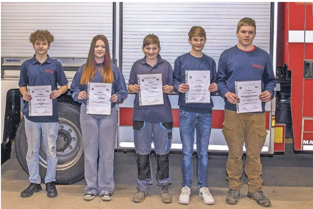
Einige Mitglieder der Jugendfeuerwehr wurden für ihre lange Mitgliedschaft geehrt.