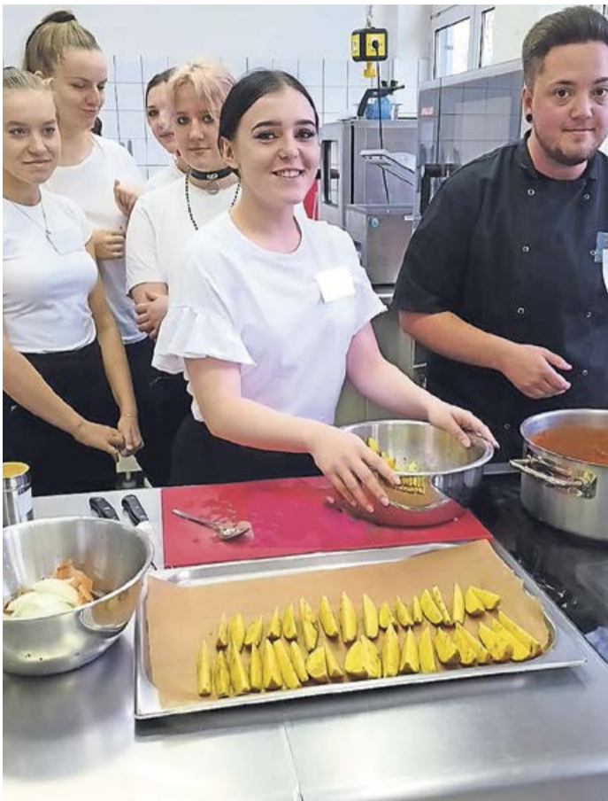
Die schulische Ausbildung zum Koch oder zur Köchin startet im kommenden Schuljahr wieder.

Bad Berleburg. Das Berufskolleg Wittgenstein bietet auch im kommenden Schuljahr wieder eine vollzeitschulische Ausbildung im Beruf Köchin/Koch an. Die praktische Ausbildung findet hauptsächlich in der Gastronomie der Schule