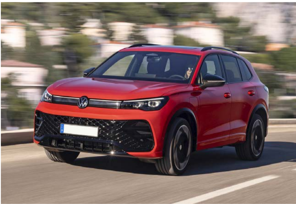
Den neuen VW Tiguan kann man beim Premierentag bei Autohaus Völkel hautnah erleben.

Autohaus Völkel in Erndtebrück stellt die neuen Tiguan, Passat und T-Cross Modelle beim Premierentag vor