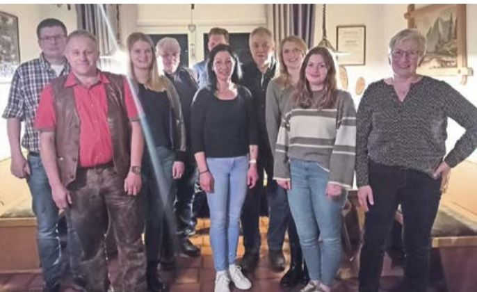
Der neue Vorstand des Pferdezuchtvereins Wittgenstein.