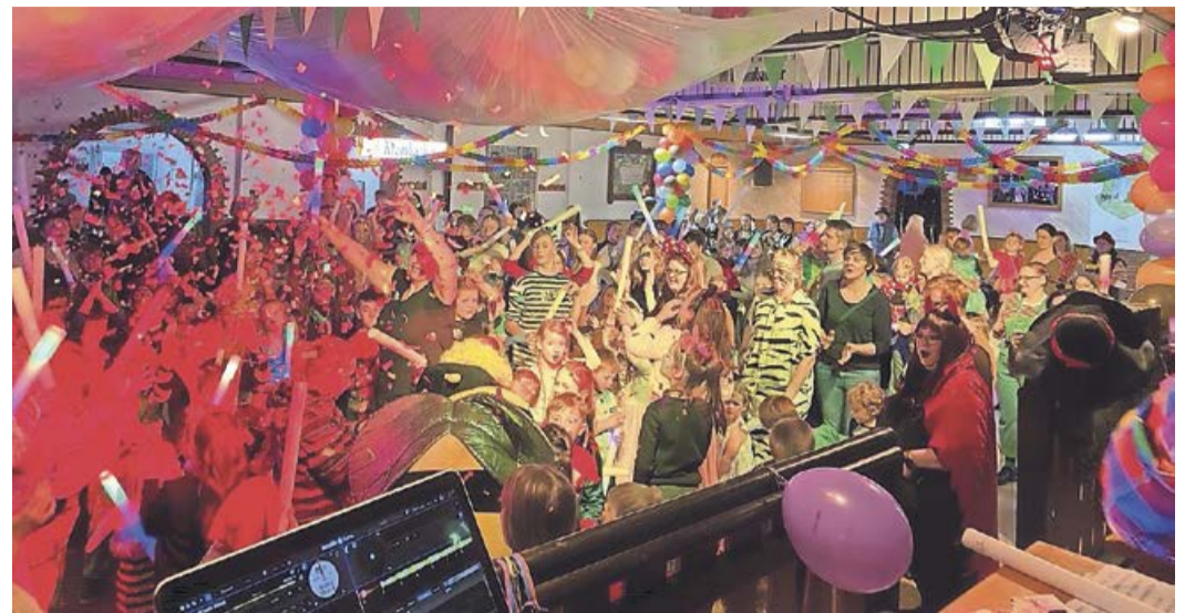
Luftballons, Konfetti und bunte LED-Sticks: beim Kinderkarneval in Girkhausen kam keine Langeweile auf.