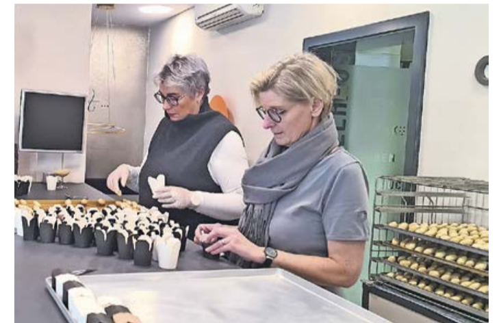
Die 6.000 goldenen Eier wurden von vielen fleißigen Helferinnen und Helfern verpackt, wobei die Aufbewahrung der Verpackung wichtig ist. Sie muss im Gewinnfall vorgelegt werden!