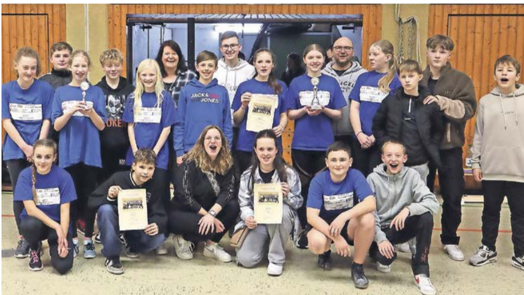
Im Hockey wurden die Banfetaler Kirchengemeinde ihrem langjährigen guten Ruf gerecht. Ihre erste und ihre zweite sorgten auf den Plätzen eins und drei dafür, dass nach dem Konfi-Cup bei Schloss Wittgenstein zwei Pokale auf Laasphe Stadtgebiet blieben.

Bad Laasphe. Obwohl Bad Laasphe aufgrund seiner Randlage im Evangelischen Kirchenkreis Siegen-Wittgenstein definitiv nicht dessen Mittelpunkt ist, war es am Freitagabend doch sein Zentrum. Jedenfalls für Jugendliche, die derzeit den