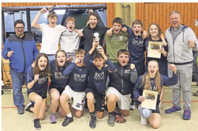
Wie gewohnt gewann das Team der Kirchengemeinden Bad Berleburg und Girkhausen im Fußball den Konfi-Cup beim Schloss Wittgenstein in Bad Laasphe.

Berleburg und Girkhausen vertreten erneut Siegen-Wittgenstein beim Westfälischen Konfi-Cup