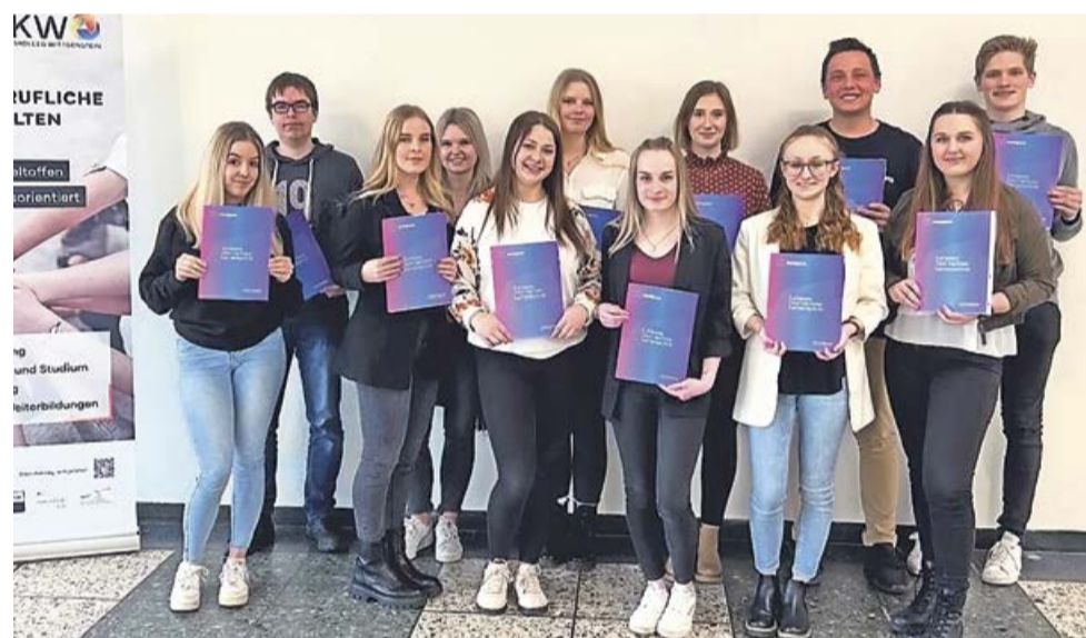
Nach dem erfolgreichen Abschließen eines dreiwöchigen Auslandspraktikums inklusive einer intensiven Vor- und Nachbereitung erhielten nun die 13 Teilnehmenden den Europass Mobilität.

Europass Mobilität an Auslandspraktikanten überreicht