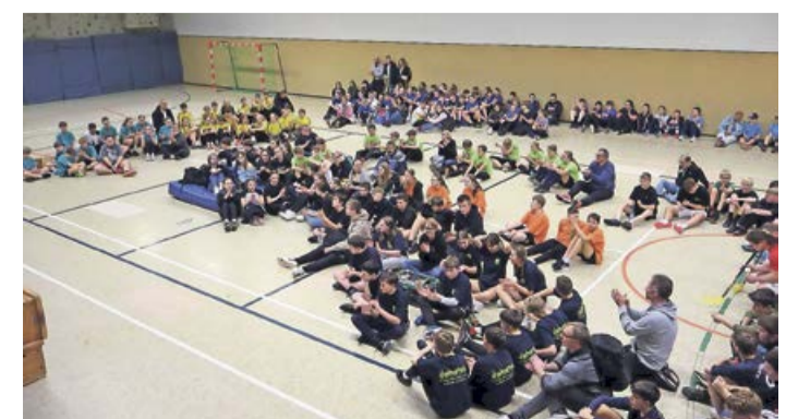
Knapp 250 Menschen waren jetzt beim Konfi-Cup des Evangelischen Kirchenkreises Siegen-Wittgenstein in den beiden Dreifachturnhallen von Schloss Wittgenstein oberhalb von Bad Laasphe.

die Mannschaft der Erndtebrücker Kirchengemeinde durchgesetzt. In der zweiten Wertung wurde die Hockey-Hochburg Banfetal ihrem guten Ruf gerecht. Den Pokal für den ersten Platz erhielt die erste, den Pokal für den dritten Platz erhielt die zweite Mannschaft aus dem Banfetal. Zweiter wurde die Wingshäuser Kirchengemeinde. Die Spielerinnen und Spieler aus den Kirchengemeinden Bad Berleburg und Girkhausen fahren nun Mitte März nach Kamen.