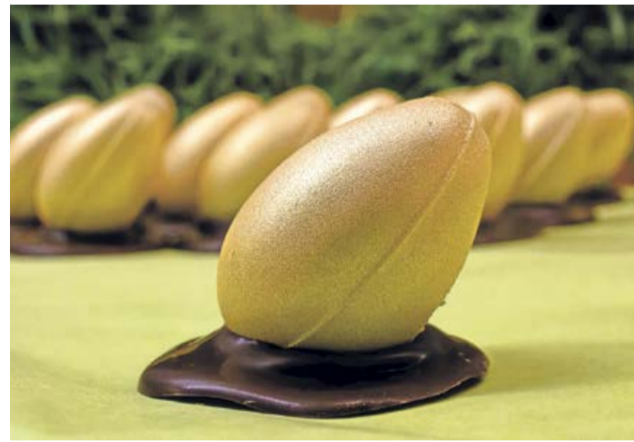
In kürzester Zeit fanden 6.000 dieser „goldigen“ Pralinenpezalität mit Gewinnchance ihre Abnehmer. Jetzt sind sie ausverkauft.

„Goldene Eier“ des Rotary Clubs Berleburg-Laasphe sind ausverkauft – Verpackung unbedingt aufheben!