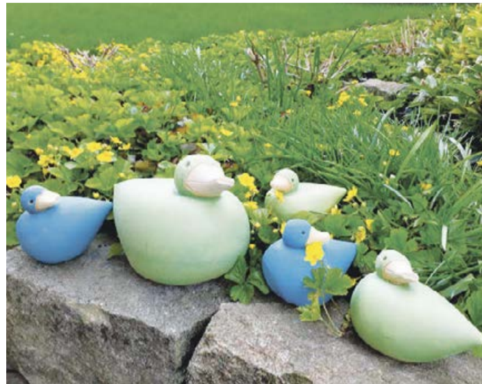
Verzaubern Sie Ihren Garten, mit den schönen und frostfesten Keramikelementen, von der Künstlerin Susanne Boerner.