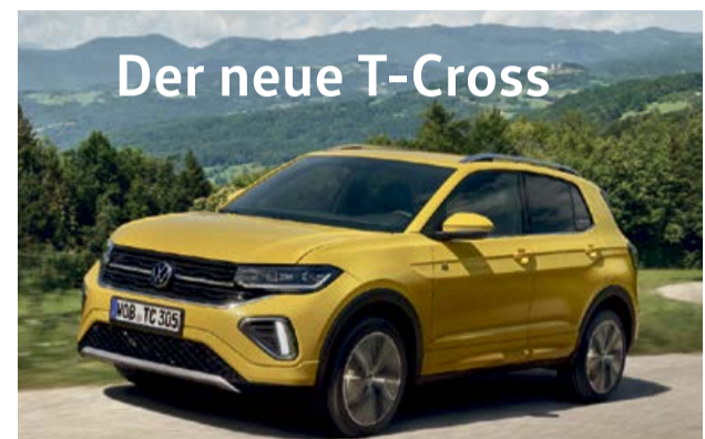
Der neue T-Cross