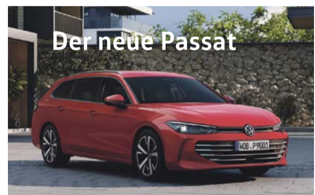
Der neue Passat