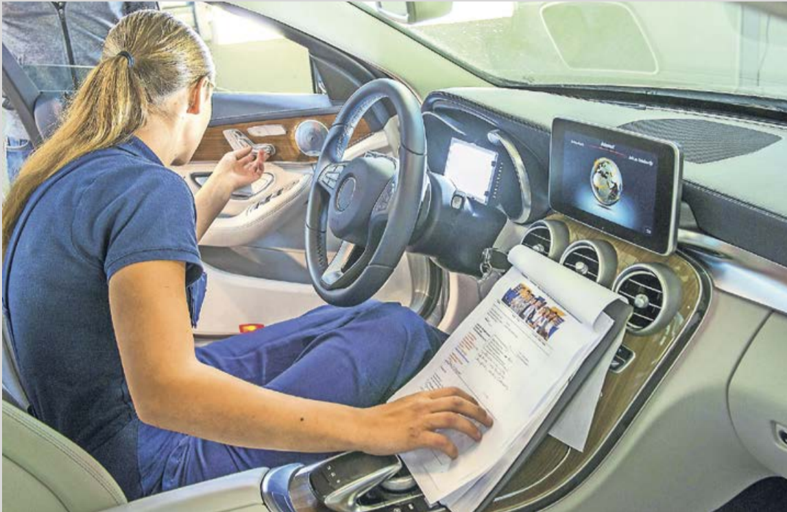
Ausbildungsberufe in der Kraftfahrzeugbranche bieten jungen Menschen gute Entwicklungschancen und zukunftssichere Arbeitsplätze.

Wandel der Mobilitätsbranche bringt neue berufliche Herausforderungen