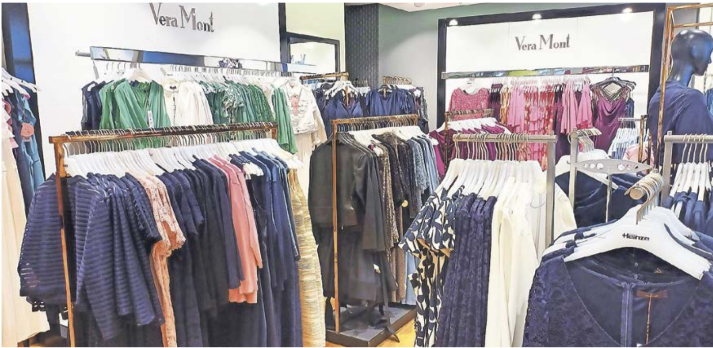
Eine breite Markenvielfalt steht den Kunden im Modehaus Heinze zur Verfügung.

Frankenberg. Nach Ostern steht für viele junge Menschen ein wichtiger Meilenstein an: Die Konfirmation. Die Wahl der richtigen Garderobe ist in der Vorbereitung für den besonderen Tag ein bedeutsamer Bestandteil. Das Modehaus Heinze in Frankenberg präsentiert passend dazu eine große Auswahl an eleganten und stilvollen Abendkleidern und Cocktailkleidern, die den besonderen Anlass perfekt unterstreichen. Die neuen Kollektionen bieten