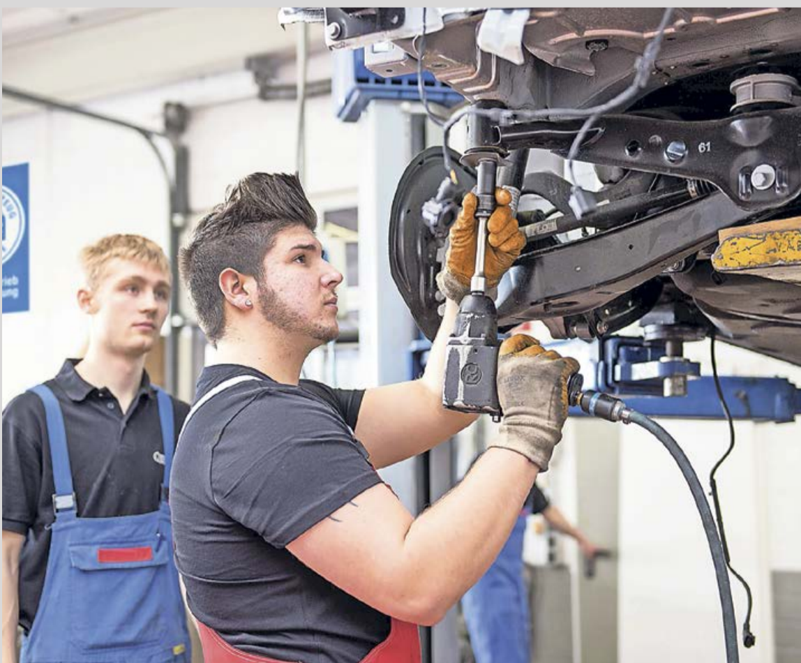
Der Kfz-Mechatroniker liegt bei jungen Männern auf Platz 1 der beliebtesten Ausbildungsberufe.

mit betrieblicher Ausbildung und Berufsschule. Unter www.wasmitautos.de gibt es eine Vielzahl von Informationen zu den Berufsbildern und ihren Anforderungen sowie einen Betriebsfinder zur Suche nach Ausbildungsplätzen. Auch die Karrierechancen durch Spezialisierungen und Höherqualifizierung werden beleuchtet. Zweijährige Weiterbildungen eröffnen zum Beispiel Wege zum geprüften Kfz-Servicetechniker, Automobil-Verkäufer oder -Serviceberater. Über den klassischen Kfz-Meister sind Aufstiege zum Werkstattmanager oder Betriebsleiter möglich, und natürlich erlaubt der Meisterbrief die Übernahme oder Gründung eines eigenen Betriebs. Wer noch mehr erreichen will, kann auch akademische Abschlüsse etwa bis zum Bachelor oder Master of Business Administration in technischen und kaufmännischen Studiengängen anstreben. (djd)