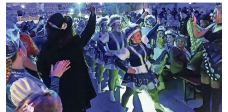
Noch nie war der Carnevalsball so gut besucht und die tolle Stimmung hielt an bis spät in die Nacht.

So standen vom ECC von den Mäusen, über die Kids und Jugend, bis hin zur Funkgarde tolle Performances in Form von Garde- und Showtänzen auf der Bühne und der Verein konnte sich freuen, in jeder Tanzgruppe einen enormen Zuwachs an Tänzerinnen und Tänzern zu haben. Das Programm wurde vom Männerballett des ECCs mit einem furiosen Auftritt beendet. Nach dem offiziellen Programm heizte der DJ Philip Torero dem Publikum noch bis in die frühen Morgenstunden ordentlich ein. Der ECC bedankt sich besonders bei dem Publikum in der Halle, aber auch bei allen, die daran gearbeitet haben, dass der Abend zu dem wurde, was er war: PERFEKT.