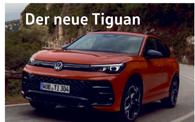
Der neue Tiguan

Tiguan Kraftstoffverbrauch (kombiniert): 6,1 l/100 km; CO 2 -Emissionen (kombiniert): 139 g/km. Passat Kraftstoffverbrauch (kombiniert): 5,4 l/100 km; CO 2 -Emissionen (kombiniert): 122 g/km. T-Cross Kraftstoffverbrauch (kombiniert): 5,6 l/100 km; CO 2 -Emissionen (kombiniert): 127 g/km. Für die Fahrzeuge liegen nur noch Verbrauchswerte nach WLTP und nicht nach NEFZ vor. Weitere Informationen unter www.vw.de/wltp