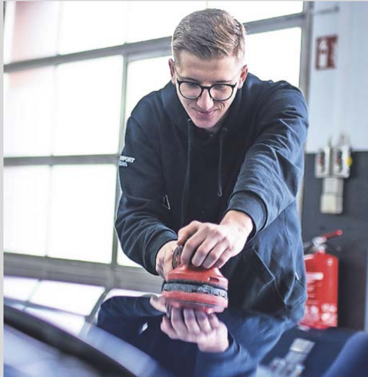
Mit ihrer speziellen Lackaufbereitungstechnologie bringt KFZ Politur Schwarz den durch den Winter strapazierten Lack wieder zum strahlen.

von den Straßen, Flugrost, Teer-rückstände oder andere Umwelteinflüsse. Doch zum Glück gibt es einen Experten, der dem Lack wieder zum Strahlen verhilft: KFZ Politur Schwarz. Mit ihrer speziellen Lackaufbereitungstechnologie entfernen sie nicht nur alle Verunreinigungen, sondern auch unschöne Kratzer. Das Ergebnis ist ein strahlender Lack, der wieder wie neu aus-