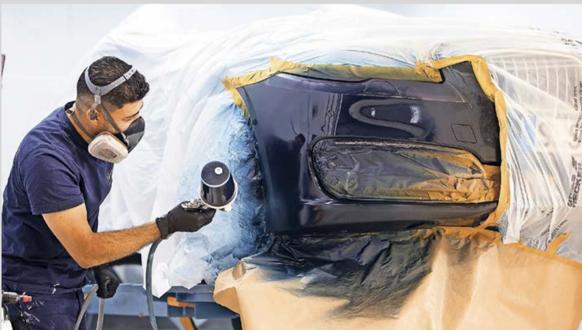
Auch beim eigenen Auto sind kleine Kratzer beim Ausparken schnell passiert und können teuer werden. Wichtig ist es daher, dass die Kaskoversicherung für die Reparatur von Parkschäden aufkommt.

Übernahme der Reparaturkosten. Diese zahlt grundsätzlich die Kfz-Haftpflichtversicherung der Person, die den Unfall verursacht hat. Passiert einem ein Parkrempler am eigenen Auto, kommt die Vollkaskoversicherung dafür auf. Durch die anschließende Hochstufung in der Schadenfreiheitsklasse kann das aber teuer werden. Der Kölner Versicherer bietet deshalb eine günstigere Reparatur über die Teilkaskoversicherung an. Einen Parkschaden an der Karosserie können Versicherte im Komfort- und Premium-Schutz einmal im Jahr in einer DEVK-Partnerwerkstatt im sogenannten Smart-Repair-Verfahren beheben lassen. Das kostet pauschal 50 Euro - ohne Hochstufung in der Schadenfreiheitsklasse. Unter www.devk.de/auto kann man sich über die Leistungen der Kfz-Versicherung informieren. Bis zum 30. November können viele ihre Police kündigen und zum neuen Jahr zu einem anderen Anbieter wechseln. (djd)