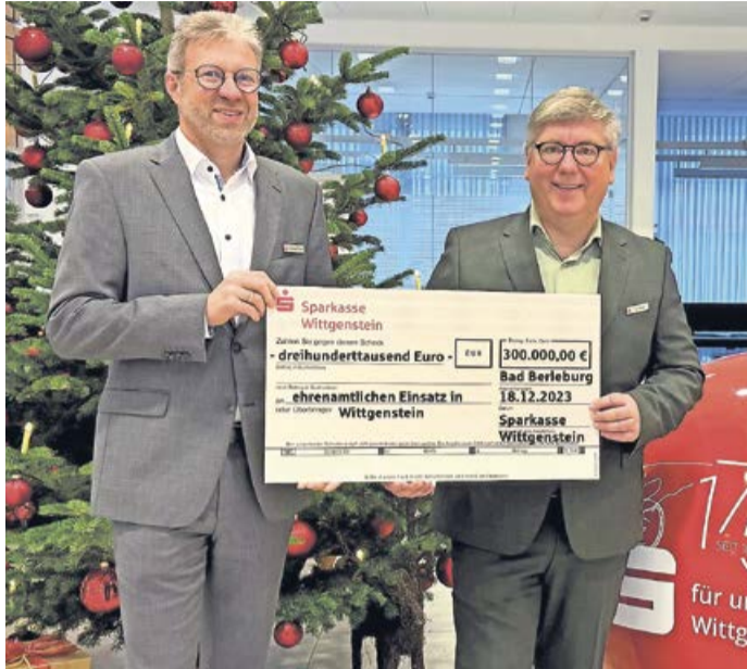
Wie auch schon im Vorjahr plant die Sparkasse Wittgenstein auch dieses Jahr wieder erschiedene Vereine und Institutionen zu unterstützen.

Die Sparkasse Wittgenstein blickt zurück – nicht nur auf das Jahr 2023