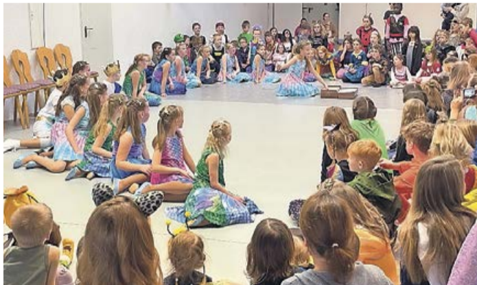
Auch ECC-Tanzgarden von den Mäusen bis zur Jugend, sowie das ECC Funken-Trio unterhielten die anwesenden Kinder mit.

Schokokuss-Wettessen, sowie Tänzen mit den Kindern und Eltern standen auch zwei große Hüpfburgen für die Kinder bereit, auf denen sich ordentlich ausgetobt werden konnte. Aber auch die ECC-Tanzgarden von den