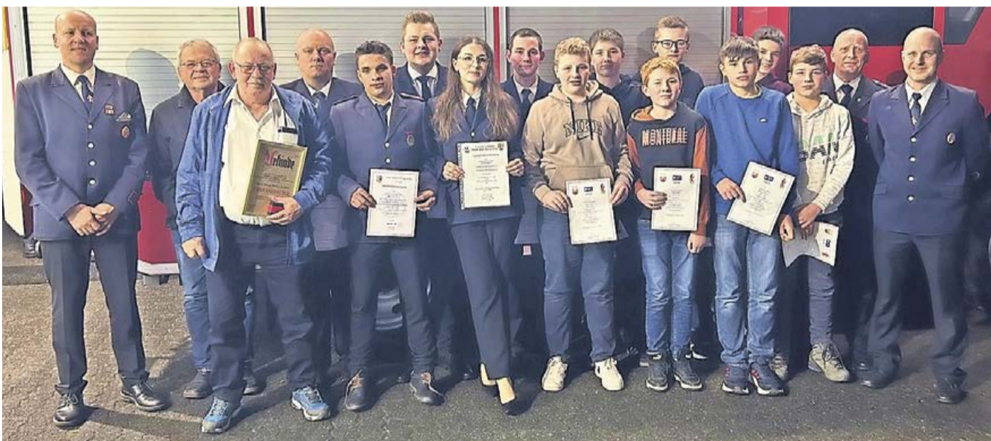
Ettliche Kameradinnen und Kameraden der Löschruppe Schüller-Wemlighausen konnten für bestandene Lehrgänge oder langjährige Mitgliedschaften geehrt werden.

Schüller-Wemlighausen. Auf der Jahresdienstversammlung schaute die Löschruppe Schüller-Wemlighausen, im Jahr ihres 100-jährigen Bestehens, auf ein historisches Jahr zurück. Im Dienstjahr 2023 wurden 32 Einsätze, so viele wie noch nie, aller Art abgearbeitet. Das vergangene Jahr begann leider wenig erfreulich, denn bei einem Brand am 12. Februar um 2.09 Uhr in der Kernstadt konnte eine Anwohnerin nur noch geborgen werden. Die folgenden Einsätze umfassten diverse Aufgaben wie das Löschen von Bränden, das Entfernen von Bäumen von Straßen und Stromleitungen sowie die Teilnahme an Übungen und Veranstaltungen.