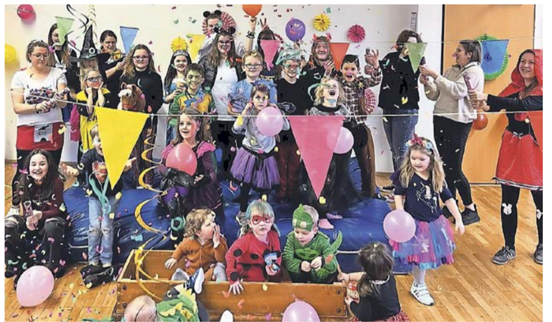
Bunte Kostüme, aufregende Spiele, leckeres Essen und Konfettiregen: Der Kinderkarneval in Beddelhausen war ein voller Erfolg.

Beddelhausen. Am vergangenen Samstagmittag war auch in Beddelhausen ausgelassene Stimmung angesagt, denn es wurde Kinderkarneval gefeiert. Die Turnhalle des Dorfgemeinschaftshauses wurde im Handumdrehen kunterbunt geschmückt, während aus den Boxen fröhliche Karnevalslieder erklangen. Ein abwechslungsreiches Programm sorgte für Unterhaltung der Extraklasse: Eine Polonaise, Luftballontanz, Reise nach Jerusalem, einen Umzug mit Kamelle