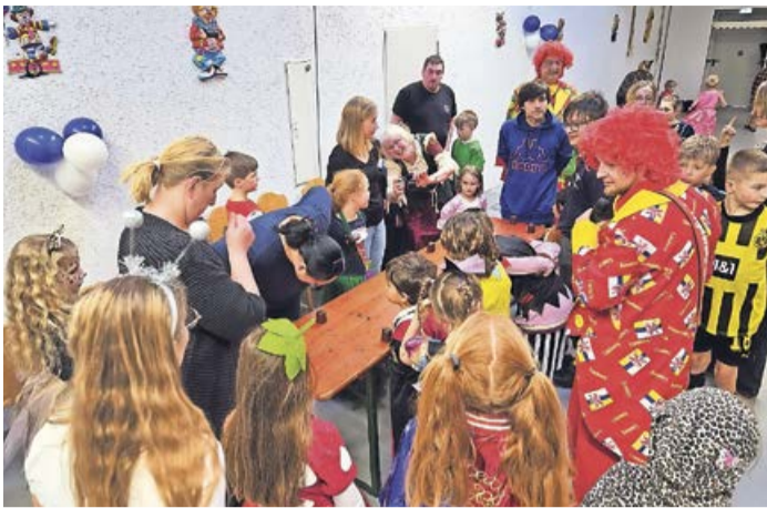
Bei vielen Partyspielen wie Reise nach Jerusalem oder Schokokuss-Wettessen konnten die Kinder gegeneinander antreten und ganz viel Spaß haben.

Erndtebrück. Am Montag, 12. Februar, fand in der Schützenhalle Erndtebrück der jährliche Kinderkarneval des ECCs statt. Ab 13.11 Uhr füllte sich die Schützenhalle immer mehr, so dass beim Programmstart um 14.11 Uhr der Ansturm so groß war, dass weitere Tische und Bänke für die Kinder mit ihren Eltern und Verwandten aufgestellt werden mussten. Mittlerweile kommen die Besucher nicht mehr nur aus Wittgenstein oder dem näheren Siegerland, sondern auch aus Siegen direkt waren Kinder anwesend.