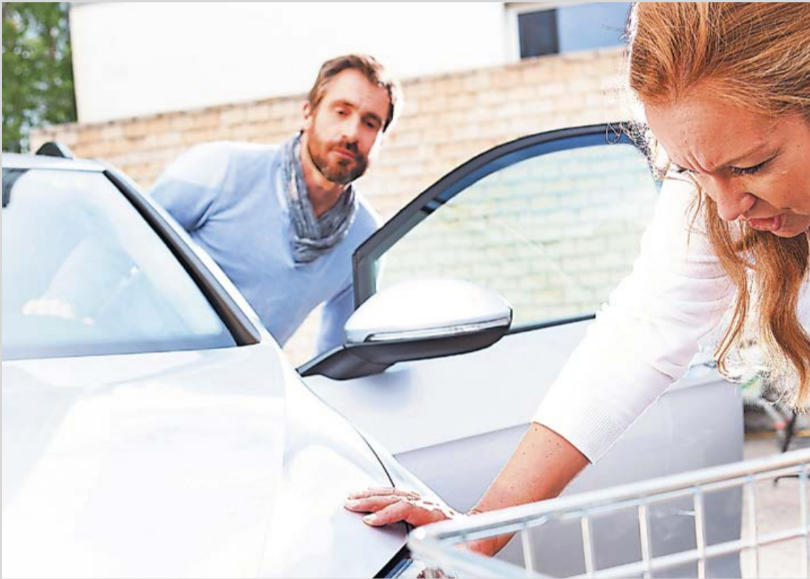
Typische Bagatellunfälle sind schnell passiert – vor allem beim Ein- und Ausparken kommt es immer wieder zu Dellen oder Kratzern am Auto.

Umfrage zeigt: Fahrerflucht nach Bagatellunfällen soll eine Straftat bleiben