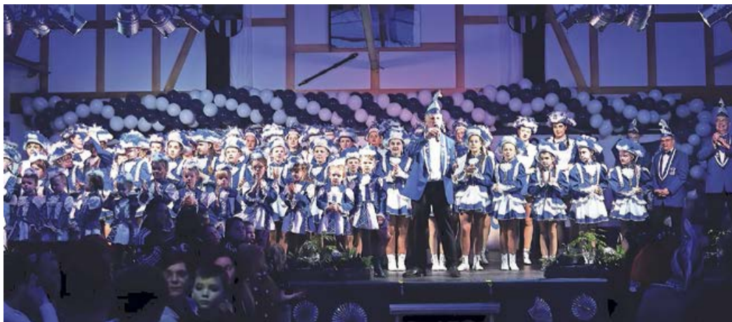
Ein buntes und vielfältiges Bühnenprogramm sorgte beim Publikum für Staunen.

Erndtebrück. Wie es um einen Verein steht, sieht man nicht nur an den Mitgliederzahlen, sondern auch an den Besucherzahlen der Hauptveranstaltungen. So war es beim Carnevalsball am Samstag, 3. Februar, das erste Mal in der Vereinsgeschichte des Erndtebrücker Carnevals Club 1983 e.V. so weit, dass der Einlass auf Grund des Ansturms stellenweise unterbrochen, sogar abgebrochen werden musste, damit die Sicherheit für alle anwesenden Gäste gewährleistet bleiben konnte. „Wir haben versucht, für alle noch zusätzliche Tische und Bänke bereit zu stellen, aber