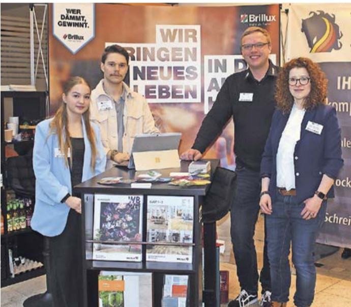
Eine bunte Auswahl an Ausstellern stand den Besuchern mit Rat und Tat zur Seite.