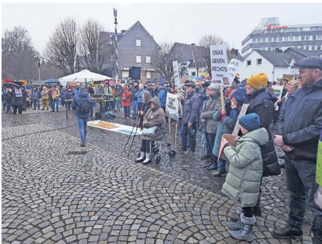
Mit selbstgemalten Schildern und bunten Fahnen demonstrierten zahlreiche Wittgensteiner gegen Rechtsextremismus und für Demokratie.