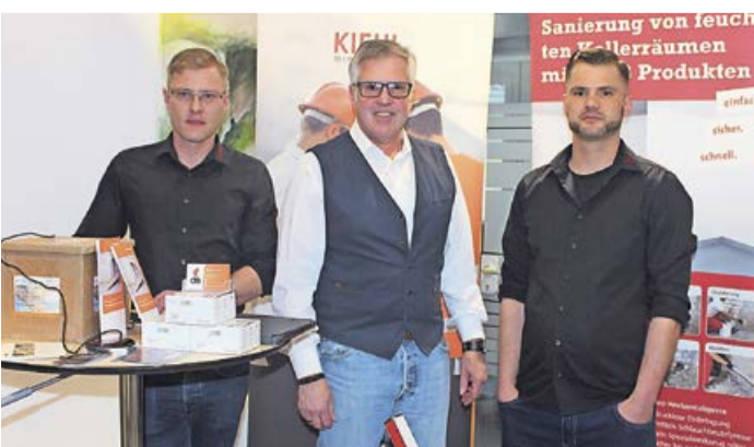
Die verschiedensten Aussteller luden die Besucherinnen und Besucher zum Dialog ein und standen mit ihrer Expertise zur Verfügung.