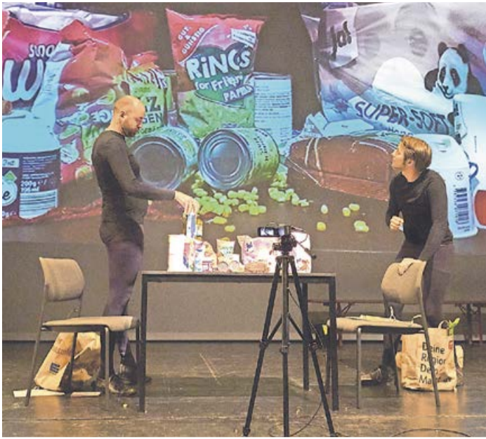
Romeo und Julia – aber als Kekse und Schokoriegel. Diese experimentelle Theateraufführung gibt es am Donnerstag, 22. Februar, im Bürgerhaus in Bad Berleburg zu sehen.

Kulturgemeinde präsentiert den Klassiker der Weltliteratur