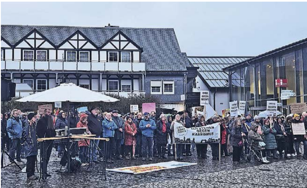
Über 600 Menschen versammelten sich am vergangenen Samstag, um ein starkes Zeichen für Toleranz und gegen Ausgrenzung zu setzen.

Bad Berleburg. Die Recherchen des CORRECTIV-Netzwerkes welche ein rassistisch und rechtsextremistisch geprägtes Treffen in Potsdam aufgedeckt haben, bei dem die „Remigration“ von zahllosen Menschen besprochen wurde, hat nicht nur Deutschland aufgewühlt, sondern auch zu einer Welle des Widerstands geführt. In zahlreichen Städten gehen Menschen