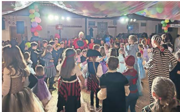
Alle sind herzlich eingeladen, beim Kinder Karneval in Girkhausen so richtig zu feiern.