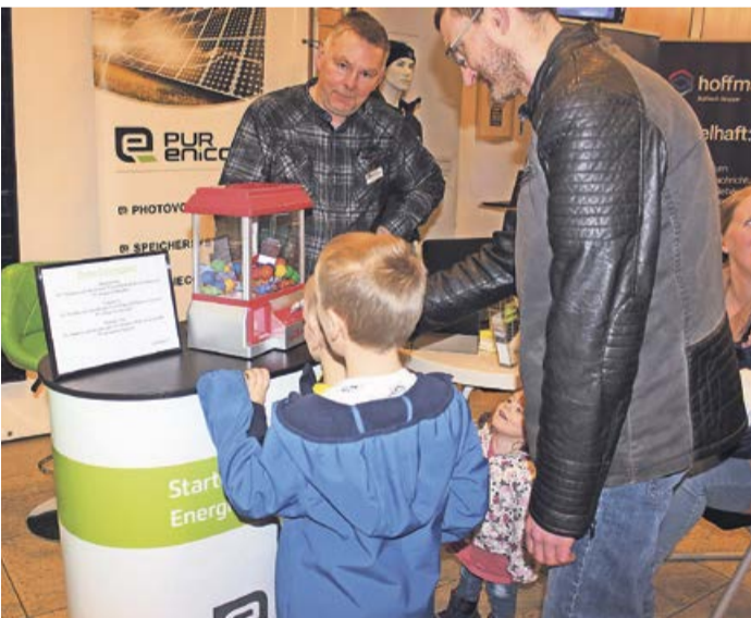
Gewinnen konnte man an manchen Ständen auch etwas. Wie hier am Stand von PUR enicon am Spielautomaten.