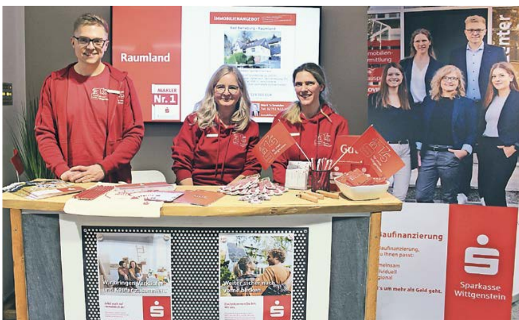
Natürlich durfte auch der Stand der Sparkasse nicht fehlen.

bei den Expertinnen und Experten rund um die Themen Hausbau, Modernisierung und Energiesparen informieren. Zu jedem Aspekt dieses Themas war eine vielfältige Auswahl an Ausstellern mit den unterschiedlichsten gestalteten Ständen vor Ort. Vom Architekten, bis hin zum Landschaftspfleger, vom Elektriker bis zum Dachdecker waren alle Branchen vertreten. Fast alle Stände hatten Ansprechpartner vor Ort. Über die Besucherzahlen zeigte man sich außerordentlich erfreut, konnte man doch einen neuen Besucherrekord aufstellen. Auch die einzelnen Vorträge zu den verschiedensten Themen rund um die eigenen vier Wände erfreuten sich größter Beliebtheit. Natürlich war auch für das leibliche Wohl bestens gesorgt. So konnte man dann um 16 Uhr abschließend in durchweg zufriedene Gesichter schauen - sowohl bei den Ausstellern als auch bei den Gästen.