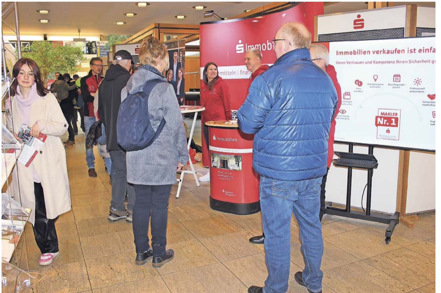
Die 15. Immobilienmesse hat einen neuen Besucherrekord geknackt. Die Hauptgeschäftsstelle der Sparkasse Wittgenstein war definitiv gut besucht.

Bad Berleburg. (wipo) Ein rundum erfolgreicher Tag liegt hinter den Veranstaltenden und den Ausstellenden der nunmehr