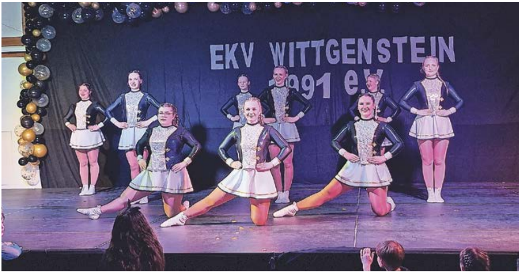
Die Funkengarde des EKV präsentierte ihren diesjährigen Sessionstanz.

EKV brannte zum 33. Vereinsjubiläum ein knapp vierstündiges Programm-Feuerwerk ab