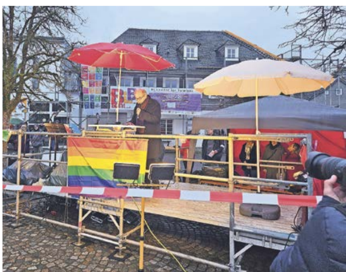
Auch die Bühne war mit einer Regenbogenfahne geschmückt.