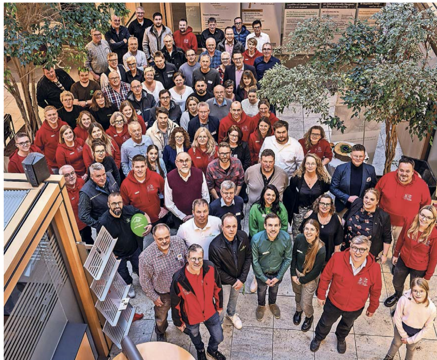
Insgesamt 52 Aussteller informierten am vergangenen Wochenende über alle Aspekte im Thema Hausbau. Lesen Sie mehr auf Seite 4.

Fischelbach. Alle Mitglieder, Freunde und Gönner des Heimatverein Fischelbach sind herzlich zur diesjährigen Jahreshauptversammlung eingeladen. Die Versammlung beginnt am Freitag, 8. März, um 19 Uhr im Dorfgemeinschaftsraum. Neben den allgemeinen Themen der Jahreshauptversammlung gibt es natürlich einen Rückblick über das vergangene Jahr, wie auch einen Ausblick auf das Jahr 2024. Im Anschluss freut man sich auf ein gemütliches Beisammensein mit Speis und Trank.