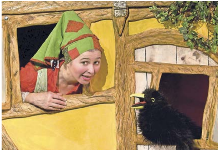
„Die kleine Hexe“ verzaubert am Donnerstag, 15. Februar, die kleinen Zuschauer und nimmt sie auf eine spannende Geschichte mit.

Bad Berleburg. Die BLB-Tourismus GmbH und der Knax-Club der Sparkasse Wittgenstein laden alle Kinder ab vier Jahren zum nächsten Kindertheater ins Bürgerhaus am Markt in Bad Berleburg ein. Am Donnerstag,