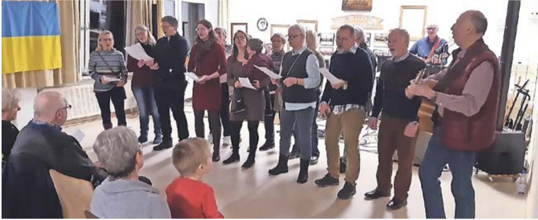
Der erste Auftritt des ehemaligen Gospelchors Puderbach nach drei Jahren.

Puderbach. Rock- und Pop-Musik der 60er und 70er Jahre fand am Wochenende im Dorfgemeinschaftshaus in Puderbach begeisterten Anklang. Rund 100 Zuhörer im Alter von 4 bis 85 Jahren konnten sich drei Stunden lang Livemusik der vierköpfigen Band aus Puderbacher und