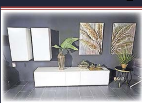
Wohnkombination „Raumfreunde“ Modell „Henri“, in Lack weiß matt 2.360,- 1.398,-