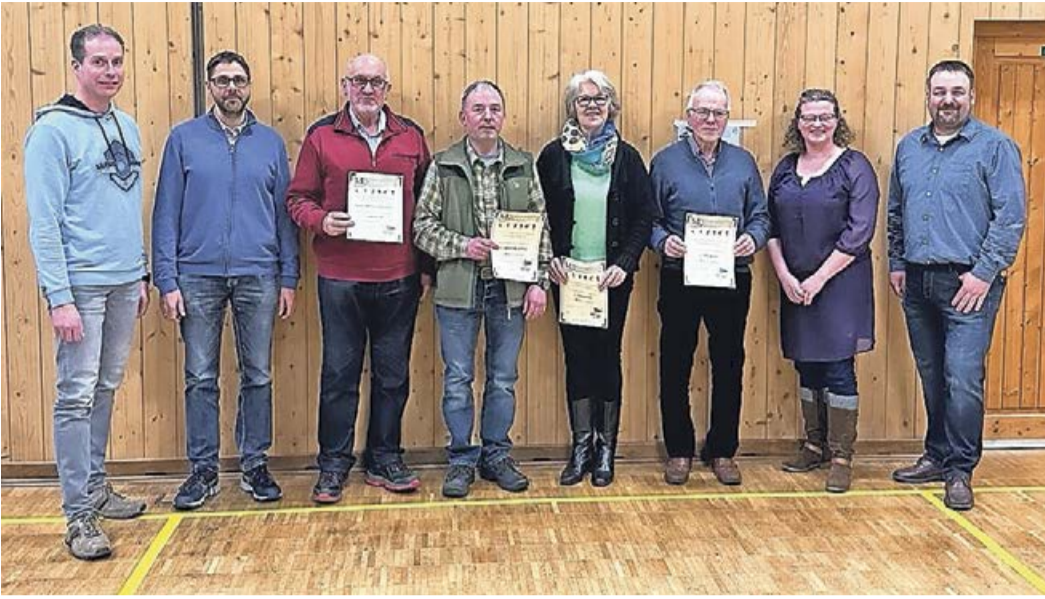
Auch in der Schwarzenauer Turnhalle gab es im Zuge der Jahreshauptversammlung einige Ehrungen vom Tus.