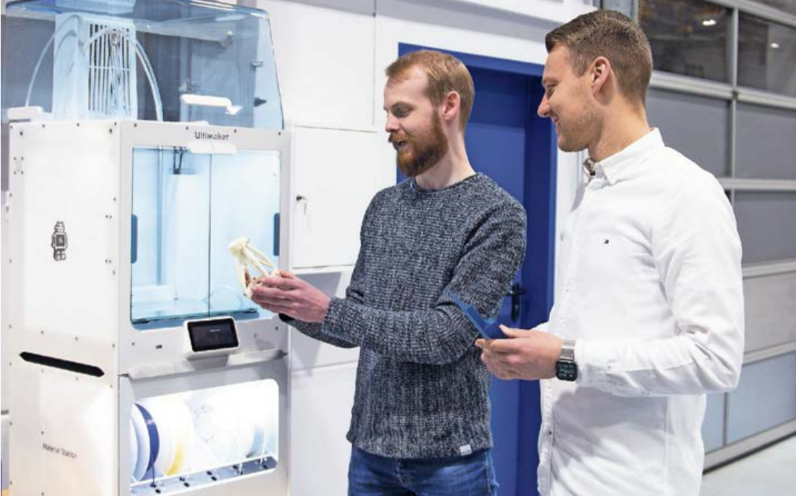
Theorie und Praxis verbinden mit dem Dualen Studium, bei der Firma Weber ist das möglich.

Theorie und Praxis verbinden mit dem Dualen Studium: Studierende und Absolventen berichten, was „Maschinenbau studieren“ bei Weber wirklich heißt