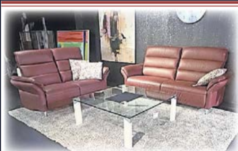
Leder-Polster- Hochlehn-Garnitur teils mit motorischer Verstellung, Sofa 3-sitzig, Sofa 2-sitzig 7.349,- 3.798,-