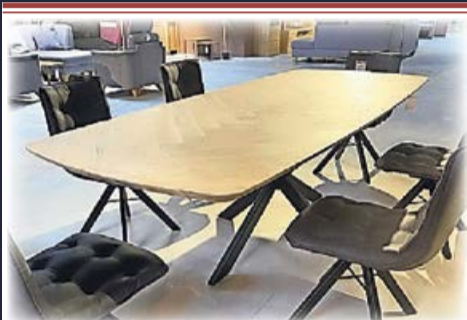
Exklusiver Esstisch Platte Eiche massiv, 260x110 cm 2.298,- 1.598,-