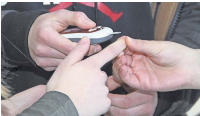
Beim Berufsfelderkundungstag am Berufskolleg Wittgenstein wurden rund 35 Berufsfelder vorgestellt.

Bad Berleburg. Am Berufskolleg Wittgenstein (BKW) fand jetzt der sogenannte Berufsfelderkundungstag statt, in diesem Jahr zum ersten Mal zeitlich getrennt von der Wittgensteiner Ausbildungsmesse, die am 13. Mai ihre Tore öffnen wird. Die Schülerinnen und Schüler vor allem der Jahrgangsstufe 8 der Wittgensteiner Schulen kamen in Scharen: Rund 360 Interessierte hatten die Gelegenheit, verschiedenste Berufsfelder und Ausbildungsberufe aktiv zu entdecken und haben nun etwas Zeit, sich mit dem Erlebten auseinanderzusetzen, bevor sie sich dann auf der Ausbildungsmesse vertiefend informieren können. Organisiert wurde der Berufsfelderkundungstag durch die IHK