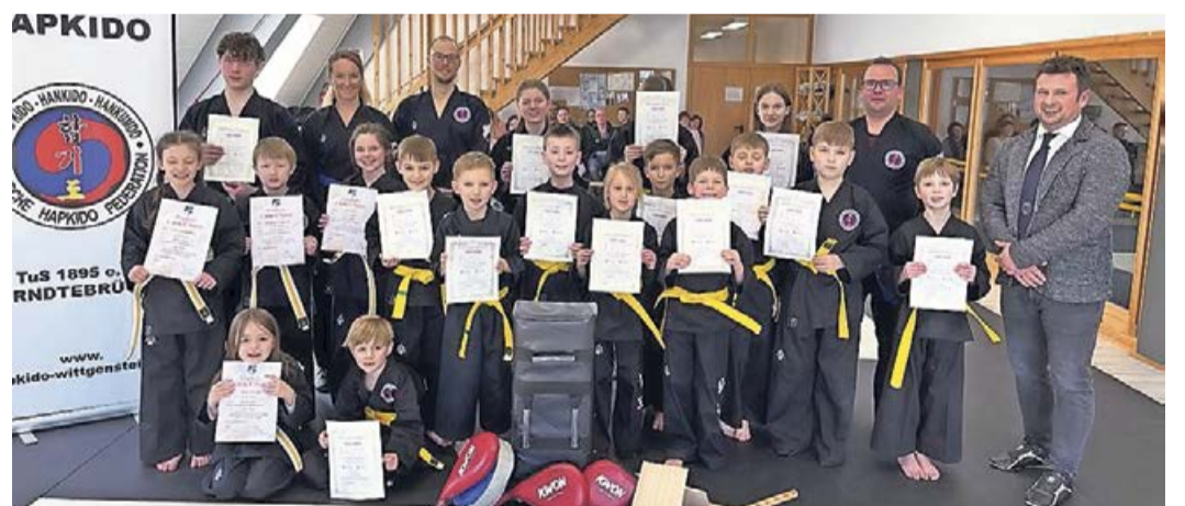
18 Hapkidoisten traten zur koreanischen Selbstverteidigung an.

Erndtebrück. Am Sonntag, 26. Februar, fanden erneut Prüfungen in der koreanischen Selbstverteidigung HAPKIDO auf den Matten des TuS Erndtebrück statt. Dieses mal traten 18, überwiegend junge Hapkidoisten der Abteilung an um ihre erste, oder nächste Graduierung zu erlangen. Durch das Trainer-Team vorbildlich in zahlreichen Unterrichtseinheiten vorbereitet konnten gute Kenntnisse der Selbstverteidigungskunst vorgetragen werden. Dabei wurden die Kids kindgerecht