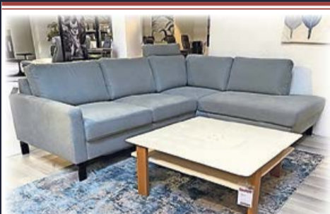
Moderne Polstereckgarnitur mit Querschläfer eingebaut, Federkernsitz, inkl. Kissen 2.498,- 1.598,-