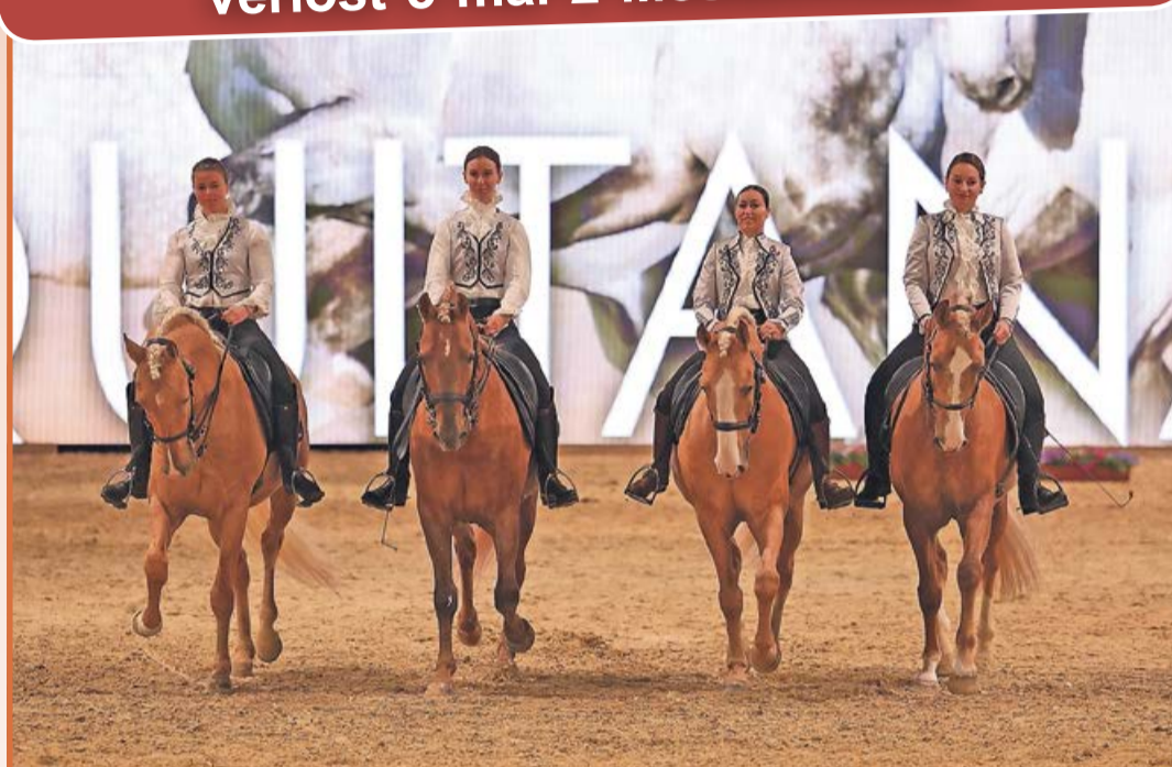
Das Programm der Weltmesse des Pferdesports vom 9. bis zum 15. März bietet eine große Vielfalt aus Sport, Show und Shopping.

Persönlichkeitsentwicklung haben, das demonstriert die international bekannte und vielfach ausgezeichnete Schauspielerin Marie Bäumer.