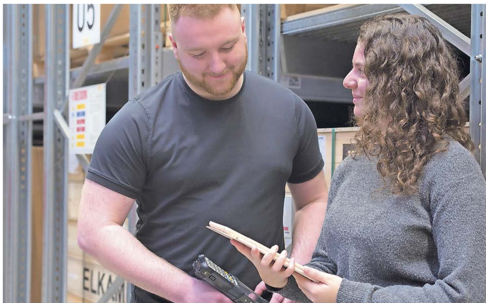
Gemeinsam statt einsam: Die Elkamet Kunststofftechnik GmbH setzt auf enge fachliche und persönliche Begleitung aller Nachwuchskräfte, sei es in der Ausbildung oder im dualen „StudiumPlus“.