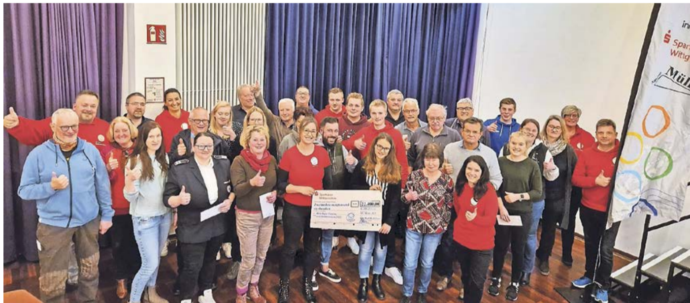
22.400 Euro an erzieltm Gewinn durch die zahlreichen Veranstaltungsformate konnte der Jugendförderverein Bad Berleburg bei der Jahreshauptversammlung im Bad Berleburger Bürgerhaus an 33 beteiligte Vereine ausschütten.