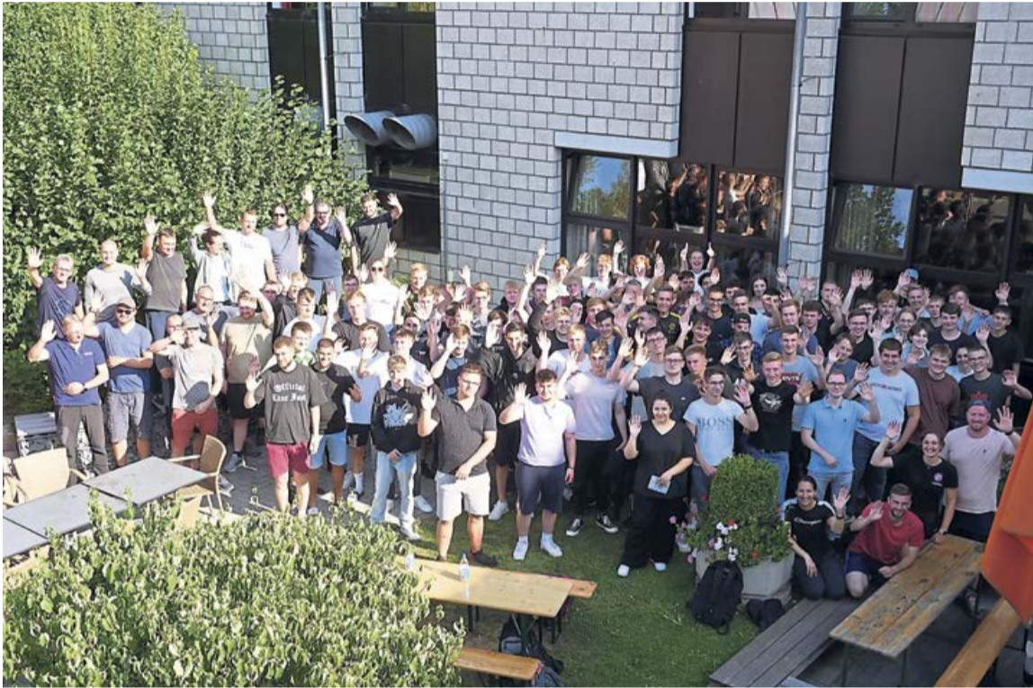
Teambuilding: Auszubildende von GEA besuchten das Ausbildungsseminar in Hachen.

Die Arbeit bei GEA wirkt sich auf das tägliche Leben weltweit aus