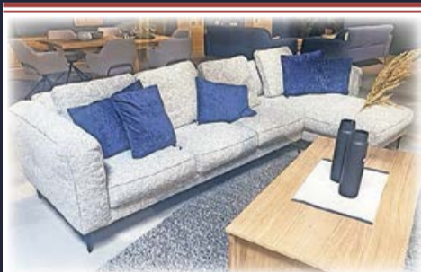
Polstereckgarnitur „Raumfreunde“ Modell „Minkel“, inkl. Kissen 2.722,- 1.598,-