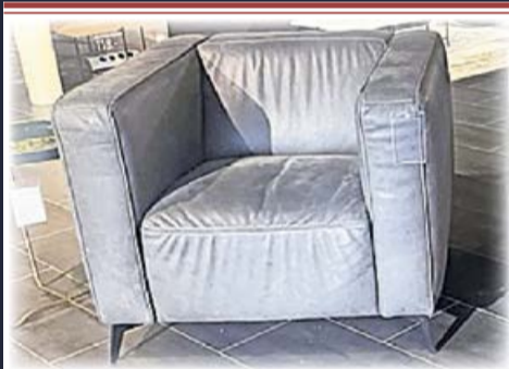
Leder-Sessel Styles United, Modell „Mareno“ 998,- 498,-