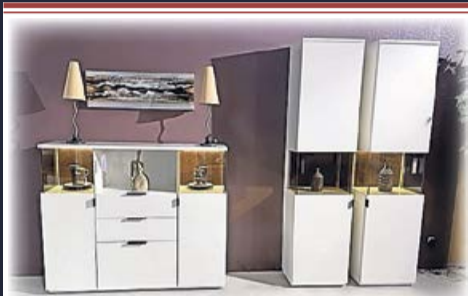
Vitrine MDF, weiß lackiert, inkl. Beleuchtung 898,- (einzeln) 498,-