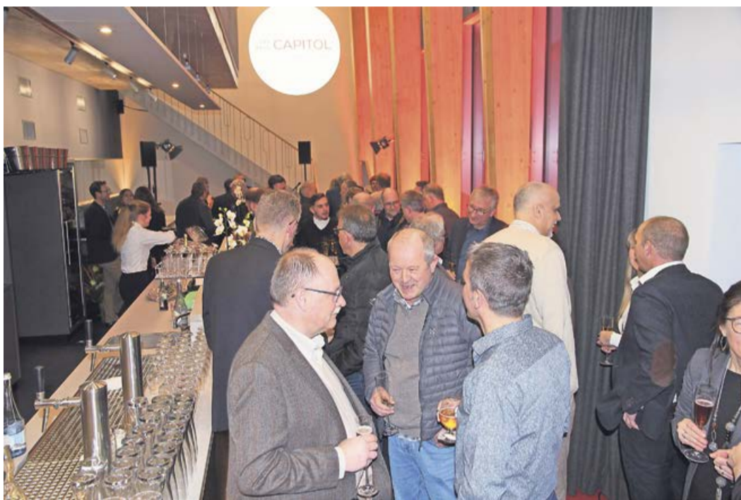
Die lange Bar ist Herzstück des neuen Capitols: Hier werden unter anderem Getränke ausgeschenkt, Tickets verkauft und Zimmerbuchungen vorgenommen.

Erster Abschnitt des Projektes „Kino – Restaurant – Hotel“ ist abgeschlossen!