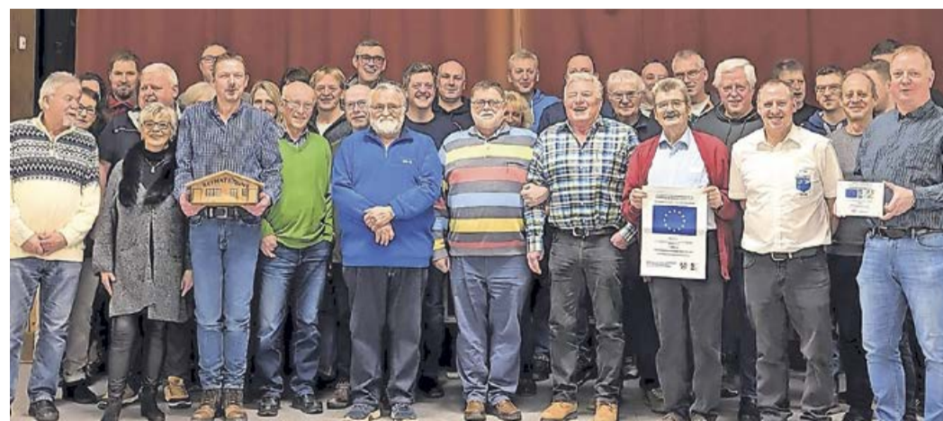
Der Heimatverein Dotzlar e.V. hofft auf viel Unterstützung beim Projekt „Heimatstuwwe“.