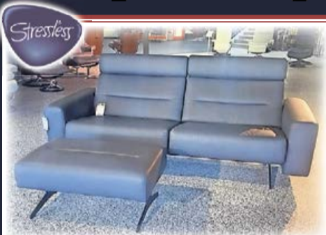
Leder-Sofa „Stella“ 2,5-sitzig, Leder Paloma, inkl. Hocker und Kopfstütze 6.200,- 2.998,-